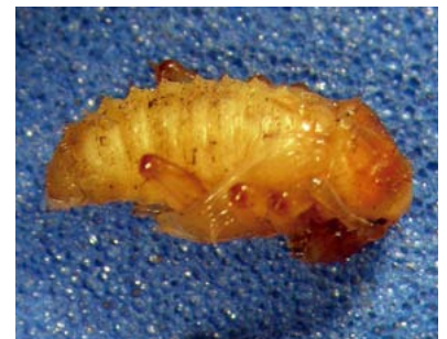
Foto 3. Pupa de O. rugosostriatus .