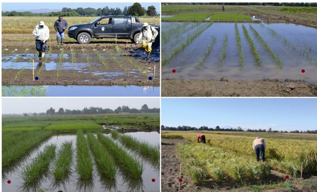
Figura 2. Evaluación de líneas experimentales Clearfield BC3. Temporada 2014-2015.

de tres hojas, se les aplicó el herbicida Eurologthning. A los 7 días de aplicado el herbicida, el testigo Zafiro-INIA comenzó a mostrar los primeros efectos de fitotoxicidad, desapareciendo completamente a los 14 días (hileras faltantes, ●). Todas las líneas experimentales Clearfield evaluadas fueron resistentes al herbicida y completaron su ciclo de desarrollo normalmente (Figura 2). La evaluación de estas líneas continuará en las próximas temporadas para obtener una variedad.