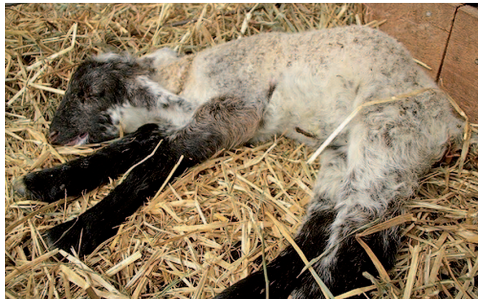
Foto 1. Cordero muerto por enterotoxemia, nótese al abdomen abultado.

Entonces, la enterotoxemia es una enfermedad relacionada con la alimentación, que causa muerte súbita debido a una toxina producida por Clostridium perfringens tipo D. Los cambios en la dieta de los animales gatillan la presencia de la enfermedad. Bajo condiciones de alimentación con