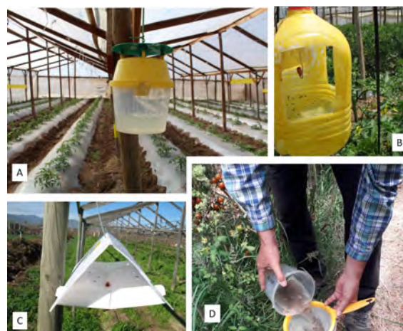
Figura 1. Monitoreo de polilla del tomate: A) Trampa de agua comercial cebada con feromona, B) Trampa de agua artesanal cebada con feromona, C) Trampa de feromona comercial tipo delta, D) Conteo de polillas.

En cada revisión de las trampas es necesario registrar la cantidad total de machos capturados y determinar el número de capturas diarias tal como se explica en el cuadro 1. Es necesario también tener en cuenta que el difusor de feromona tiene una duración aproximada de 30 días, dependiendo de las condiciones climáticas, es decir, debe renovarse una vez al mes. Además, para su almacenamiento y/o transporte es importante no romper la cadena de frío (conservar a -5 °C).