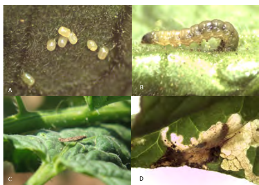
Figura 3: Distintos estados de desarrollo de la polilla del tomate. A) huevo, B) larva, C) Adulto, D) larva en galería (galería activa)

La cantidad de huevos, larvas y/o galerías activas encontrados en cada foliolo monitoreado (Figura 3), se debe anotar en un cuaderno o planilla de monitoreo, formando un "registro".