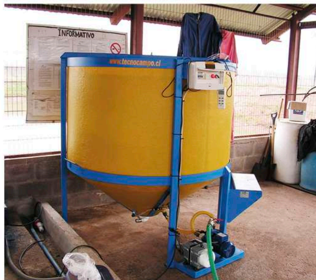
Té de compost a pequeña escala (arriba) y en grandes volúmenes (abajo).