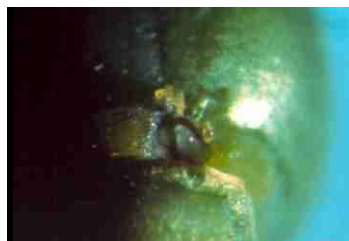
Foto 3. Emergencia de la larvita de Trips, (Foto: Sr. Renato Ripa Sch, INIA - La Cruz)

Con forma de riñón, hialino, la hembra lo inserta bajo la epidermis tejido vegetal.