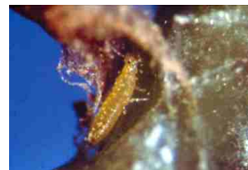
Foto 4. Ninfa de Trips alimentándose de polen.

Luego buscan el suelo para esconderse entre la hojarasca y mudan al estado de prepupa y luego de pupa. En estos estados se observa el desarrollo externo de las alas.