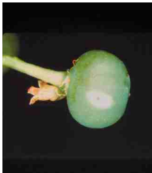
Foto 1: Halo en bayas de vid provocado por la ovipostura de Trips

El trips californiano, Frankliniella occidentalis (Pergande), es una plaga extremadamente polífaga y ampliamente distribuida en el mundo, capaz de producir daños severos a frutales, hortalizas y plantas ornamentales tanto al aire libre como en invernaderos. En uva de mesa esta plaga reviste particular importancia en la Región de Coquimbo ya que además del daño directo (halos de ovipostura, partidura de bayas y algunos russet), Foto 1, su daño se asocia frecuentemente al problema de pudriciones en postcosecha.