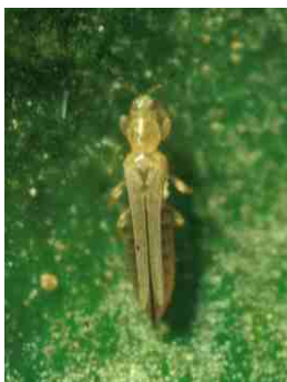
Foto 2. Adulto de Frankliniella occidentalis

Cuatro pares de setas en ángulos del protorax, dos en margen anterior y dos en el margen posterior.