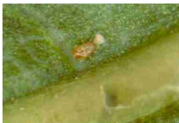
Foto 5: Ácaro Predador de ninfas de Trips ( Phytoseido ).

Entre los parásitos está una avispa Eulokhidae, Ceranisus menes de menos de 1 mm de largo, negra y con patas amarillas, que se presenta frecuentemente en flores de alfalfa, palqui y malezas además de nemátodos del Género Thripinema .