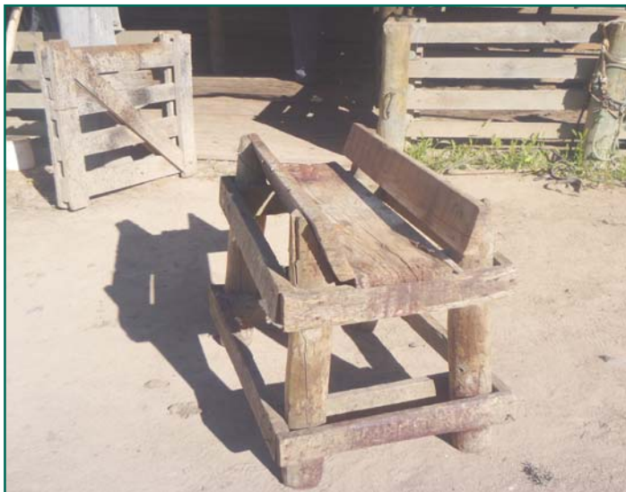
Foto 1. Banco para descole

1.- Bisturí o cuchillo. Es el método más usado, y consiste en cortar con un cuchillo afilado en la zona seleccionada. La operación se verá facilitada si participan dos personas y además se cuenta con un banco acondicionado para esta labor (Foto 1). Una persona sujeta al cordero por sus extremidades y lo sitúa en el banco de espalda y exponiendo la cola (Foto 2)