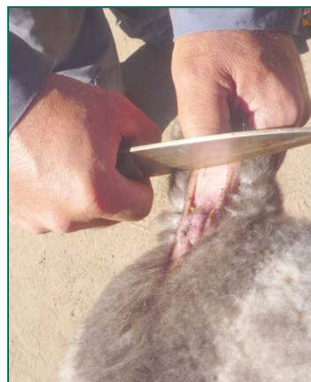
Foto 5. Corte de cola