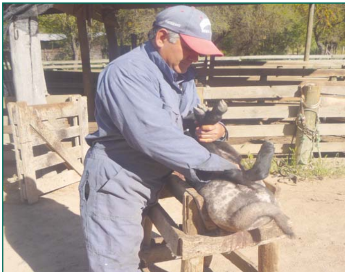
Foto 2. Ubicación del ovino en el banco para el descole