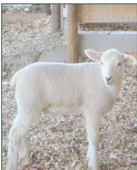
Foto 6. Cordero descolado