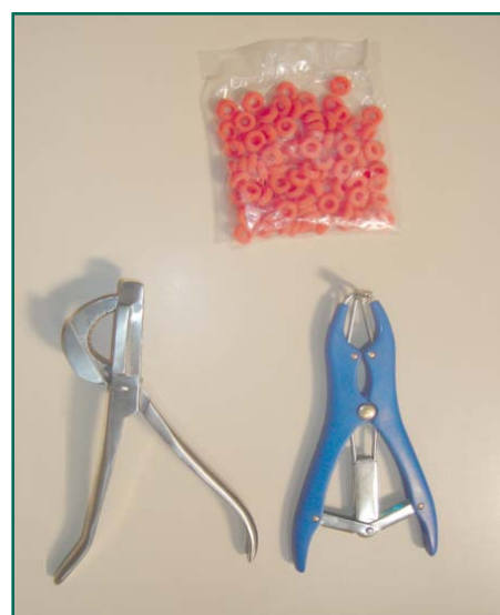
Foto 8. Elastrador