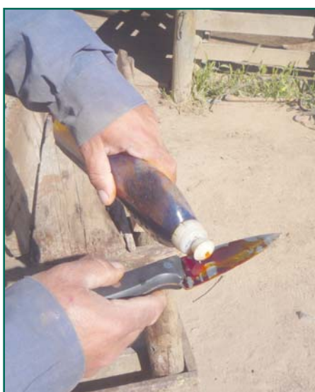
Foto 7. Desinfección del cuchillo