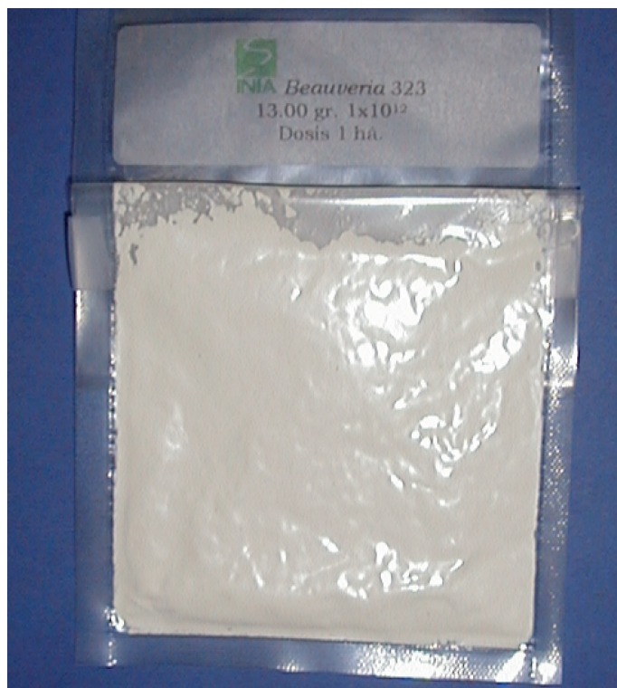
Figura 3. Conidias puras de Beauveria , formuladas al vacío y deshidratadas.

La investigación sobre HEP se ha incrementado en los últimos años, debido a la presión por disminuir el uso de los insecticidas de síntesis química y la búsqueda de nuevas formas de control de plagas más amigables con el medioambiente. Estudios desarrollados en los últimos tres años, han