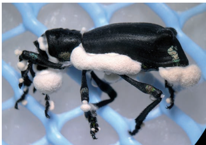
Figura 4. Adulto de Cabrito del ciruelo colonizado por Beauveria .

Para el éxito de un tratamiento con HEP, se debe recordar que independiente de la formulación y método de aplicación, siempre se debe tener presente que los HEP son organismos vivos y como tal son susceptibles a la radiación ultravioleta, desecación, altas temperaturas, envejecimiento y fungicidas de síntesis química, factores que dependen exclusivamente del agricultor que utiliza este tipo de control y que pueden afectar significativamente la efectividad de la aplicación en condiciones del campo.