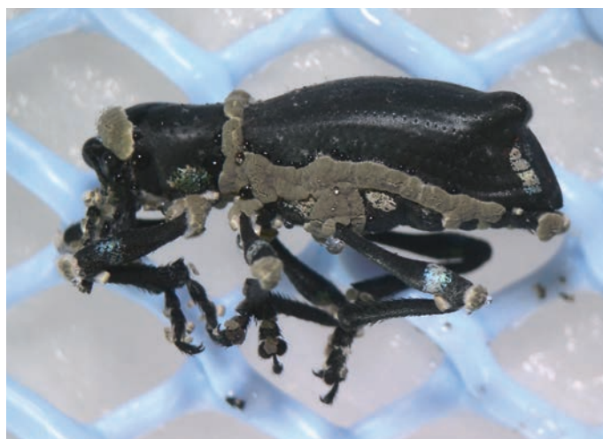
Figura 5. Adulto de Cabrito del ciruelo colonizado por Metarhizium .