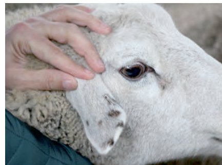
Manchas en las orejas.