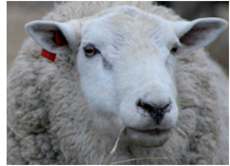
Lagrimal oscuro, nariz acampanada y negra.