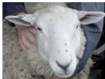
Manchas negras en la cara.