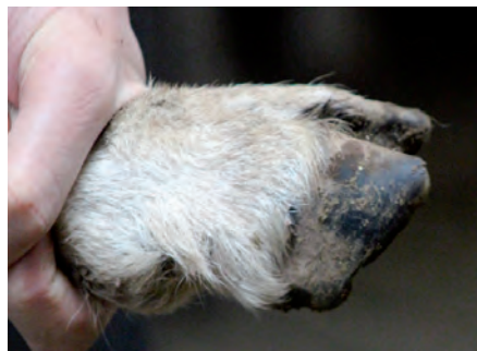
Pigmentación blanca en la pezuña.