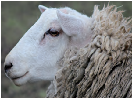
Cabeza descubierta de lana y lagrimal oscuro.