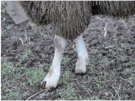
Extremidades descubiertas de lana.