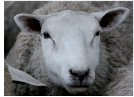
Posición de las orejas.