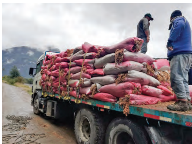
Fotografía 2. Sacos de musgo Sphagnum transportado para ventas.

La importancia de detectar a estos actores en los territorios donde se encuentran las Turberas de Sphagnum , es lograr su integración y representación de las comunidades locales en mesas de trabajo regionales, lugar donde se centran las decisiones y se canalizan las políticas públicas. Además, permite focalizar el plan de capacitación, lo que se traducirá en una población informada y empoderada de este recurso, logrando a mediano y/o a largo plazo gestionar regionalmente las turberas de Sphagnum , comprometiéndolos a su conservación y uso sustentable.