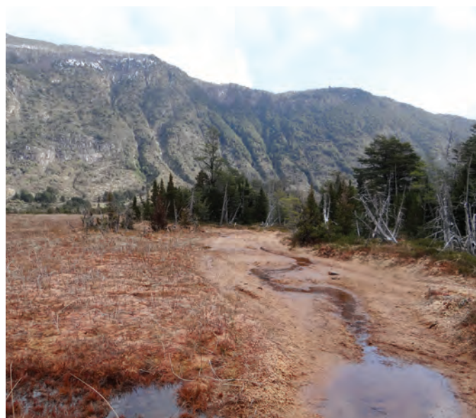
Fotografía 1. Huella de vehículos en turbera de Sphagnum

• Representantes ambientales de la ciudadanía, organizaciones sociales: Corresponden a Organismos No Gubernamentales (ONG) y científicos que trabajan en centros de investigación y universidades locales, ya que aportan con información y conocimiento.