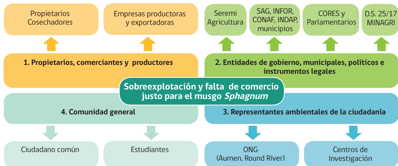
Figura 3. Mapa de actores sociales relacionados a la actividad de corte y cosecha de musgo Sphagnum en la Región de Aysén.

• Comunidad en general: Se encuentran personas naturales que desconocen lo que ocurre en torno al musgo, sin embargo, pueden involucrarse en la gestión del recurso y su actividad, en el momento de conocer la actividad o el problema que ella puede acarrear, ejemplos: comunidad estudiantil, personas de rubros distintos a los silvoagropecuarios, ciudadano sin relación con el recurso. También, organizaciones sociales comprometidas con el desarrollo sustentable (juntas de vecinos, etc.). En este grupo se ha centrado el plan de difusión, por la importancia de informar a la comunidad sobre los recursos naturales, sus ecosistemas y las actividades que existen o pueden existir en torno a ellos.