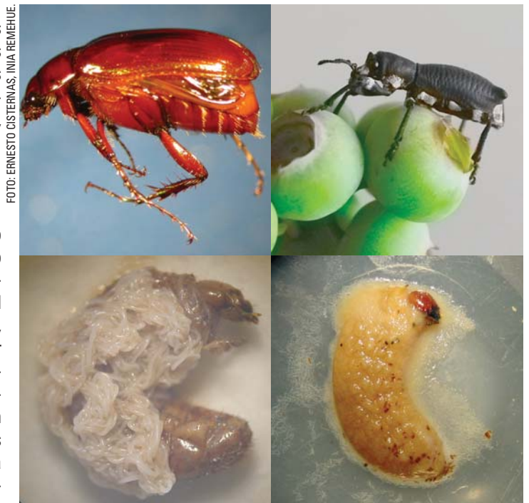
Foto 2. Adulto y larvas parasitadas con aislamientos nativos de nematodos entomopatógenos de pololito dorado, Sericoides viridis , (izquierda) y de cabrito del duraznero, Aegorhinus superciliosus (derecha).

Estudios realizados en INIA Quilamapu con aislamientos nativos de nematodos entomopatógenos han mostrado promisorios resultados en el control de especies como capachito de los frutales ( Asynonychus cervinus ), cabrito del duraznero ( Aegorhinus superciliosus ) y el gorgojo de los invernaderos ( Otiorhynchus sulcatus ), todas especies que poseen estados larvales que habitan en el suelo alimentándose de raicillas y causando un severo daño a la planta. En el caso del cabrito del duraznero, el insecto horada la raíz principal, introduciéndose en ella y causando la muerte de la planta. El hábitat de estas especies dificulta