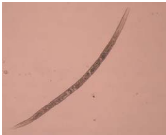
Foto 1. Individuo juvenil infectivo de nematodo entomopatógeno.

Los nematodos entomopatógenos (NEP) corresponden a gusanos microscópicos habitantes del suelo. Poseen la habilidad de alimentarse de insectos valiéndose para esto de una asombrosa asociación con una bacteria simbiote de la cual se alimentan y que a su vez transportan e inoculan como una verdadera "inyección biológica".