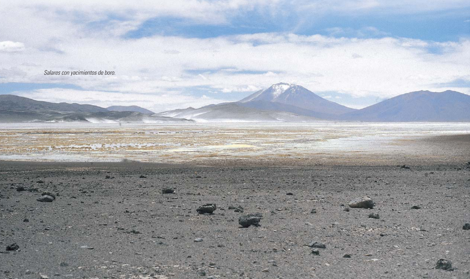
Salares con yacimientos de boro.