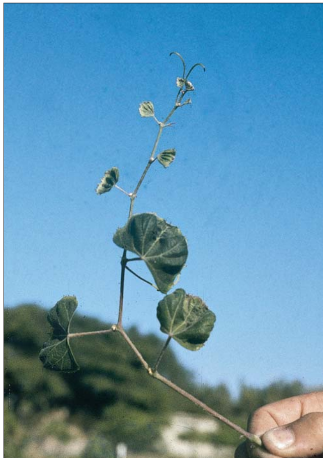
Síntomas de deficiencia de boro en vid.

Las formas aniónicas en solución, tales como B(OH)_4 o H_3BO_3 , reaccionan de preferencia con arcillas-aluminio o hierro y óxidos de aluminio, si el pH es ácido, o con hierro, si el pH es alcalino. En suelos ricos en este tipo de cargas dependientes del pH, se produce retención de boro. Otras de las causas que originan deficiencia de boro en los suelos, son la intensidad de los cultivos y la obtención de elevados rendimientos por efecto del empleo de variedades de alto potencial productivo, por ejemplo en el caso de los maíces híbridos.