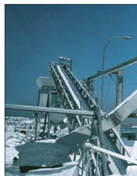
La extracción del boro en los salares.

Una condición de deficiencia de boro extrema puede significar reducir los rendimientos en menos de un 50% en desarrollo vegetativo y hasta un 100% en lo que se refiere a la producción de semillas.