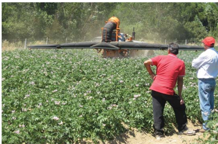
La asesoría de consultores expertos es fundamental para el éxito de un emprendimiento agrícola.

Uno de los elementos esenciales del mejoramiento de los servicios de asesoría técnica, es el levantamiento de un Registro Nacional de Consultores de Fomento que contendrá información actualizada no sólo de los datos de contacto, especialidades, equipos profesionales y experiencia laboral de cada consultor o empresas de