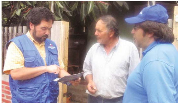
Los consultores deberán someterse periódicamente a evaluaciones de su desempeño y resultados, de modo de ofrecer valiosa información a los productores a la hora de elegir a aquellos que respondan a sus requerimientos.

“Como INDAP queremos generar las condiciones para que la asesoría de los consultores sea de la mejor calidad, pues se trata de un punto crítico para entregar un servicio de buen nivel a nuestros usuarios.”