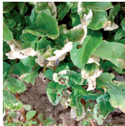
Foto 4. Daño.

INIA más de 50 años aportando al sector agroalimentario nacional