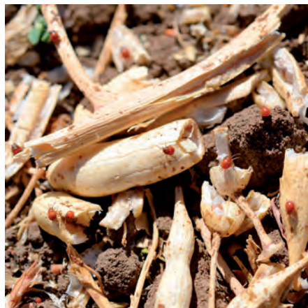
Foto 3. Ninfas.