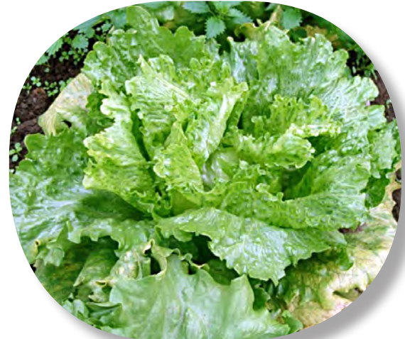
Mosaico y venas gruesas.