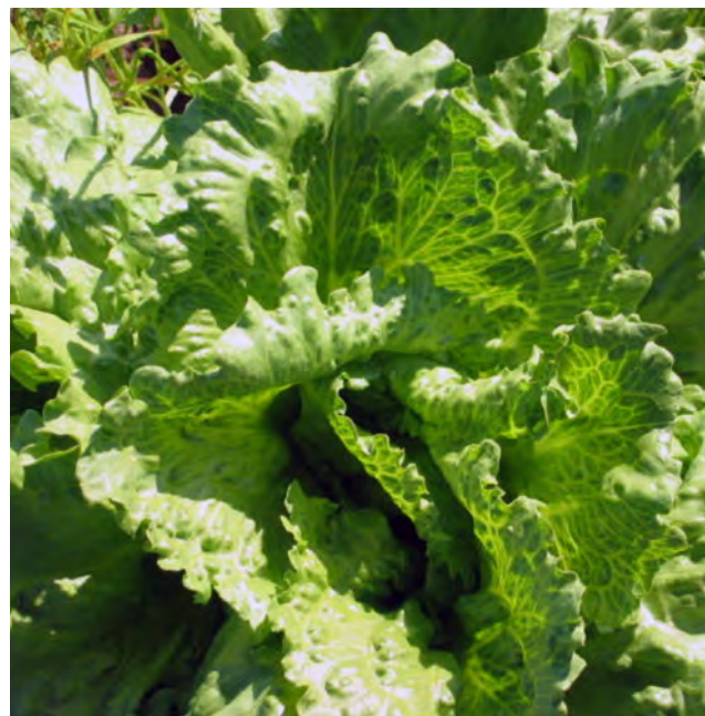
Mosaico y engrosamiento de venas.