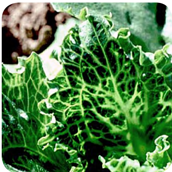
Venas gruesas en lechuga.

Nombre agente causal: Virus Mirafiori de la lechuga Virus de la vena ancha de la lechuga