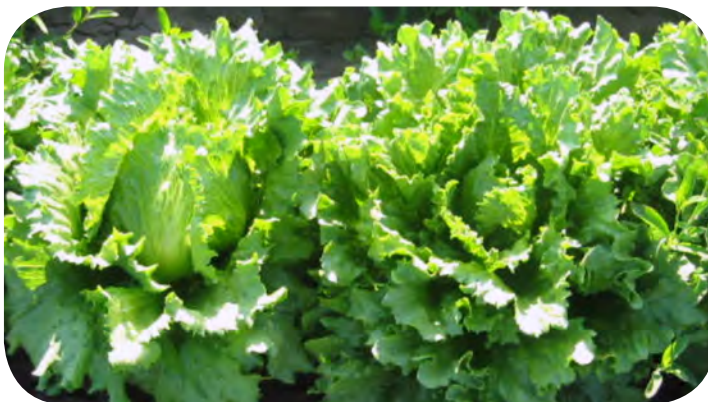
Se observa la falta de formación de cabeza en lechuga de la derecha.

La enfermedad permanece en plantas enfermas y en el suelo asociado a restos de raíces afectadas y al hongo vector.