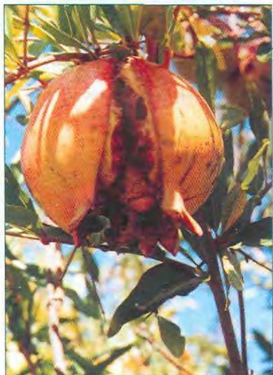
Frutos de granado con partidura. este problema facilita el ataque de hongos depreciando la fruta.

El potencial productivo del granado es de 10 a 12 ton/ha u 8 a 16 kg/árbol. La producción se ve afectada en suelos arenosos y, también, por podas fuertes. La cosecha se realiza antes que la fruta alcance su total madurez. Durante la temporada es posible realizar dos o tres cosechas, si se cosecha sólo los frutos que están maduros, ya que el proceso en el árbol es paulatino. En algunas variedades los frutos tienden a romperse cuando maduran, por lo que se debe cosechar antes que esto se produzca, ya que frutos rotos son más susceptibles a pudriciones y se deprecia su valor económico.