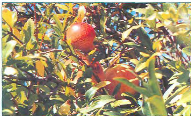
Frutos de granado común próximos a cosecha.