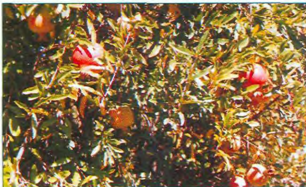
Granado común creciendo en el secano interior.

En el secano interior este frutal sólo se encuentra en huertos caseros y jardines.