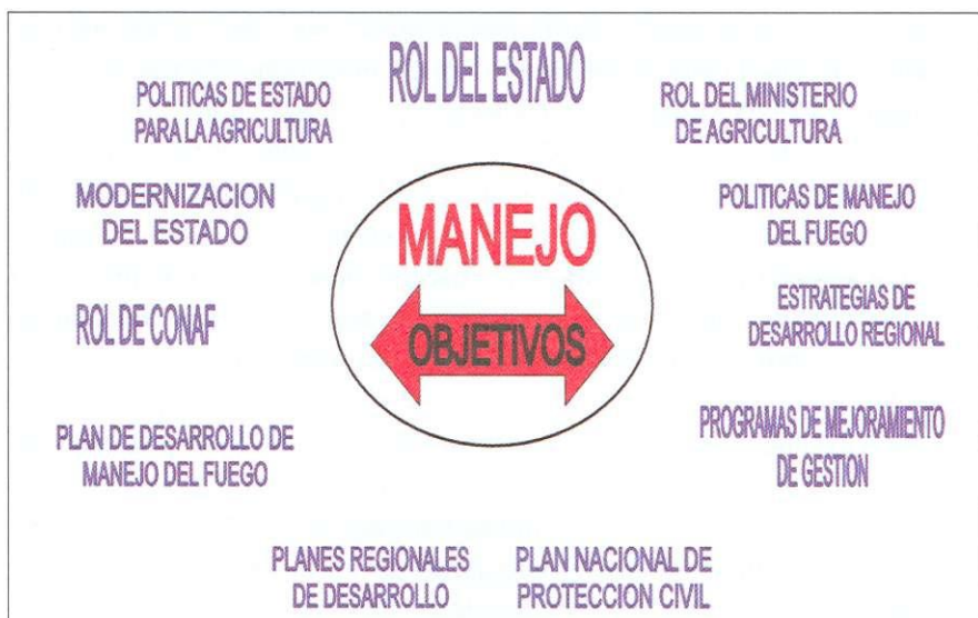
Figura 16.2. Compromisos institucionales relacionados con el manejo del fuego.

Si se analizan los compromisos que tiene CONAF y particularmente el Departamento de Manejo del Fuego en el ámbito político e institucional, se observa claramente que se espera una contribución efectiva en los procesos de desarrollo del sector agrícola y forestal, particularmente a nivel de los pequeños y medianos propietarios, considerando las características propias del lugar geográfico o territorio donde viven. Además, se manifiesta claramente que este objetivo se debe lograr a través de la eficiencia en las tareas asignadas, optimizando los recursos públicos, satisfaciendo en forma óptima al usuario y mejorando la imagen Corporativa.