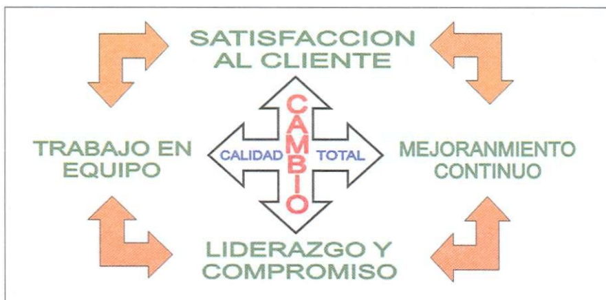
Figura 16.1. Modelo de gestión para el manejo del fuego.

Sin embargo, uno de los aspectos de este modelo de gestión que tiende a desarrollarse con menor fuerza, dice relación con el trabajo en equipo y el compromiso de los integrantes de la organización en los procesos de mejoramiento continuo. Esto, básicamente ocurre, entre otros aspectos, cuando no existe claridad respecto a los objetivos o resultados que pretenden lograrse.