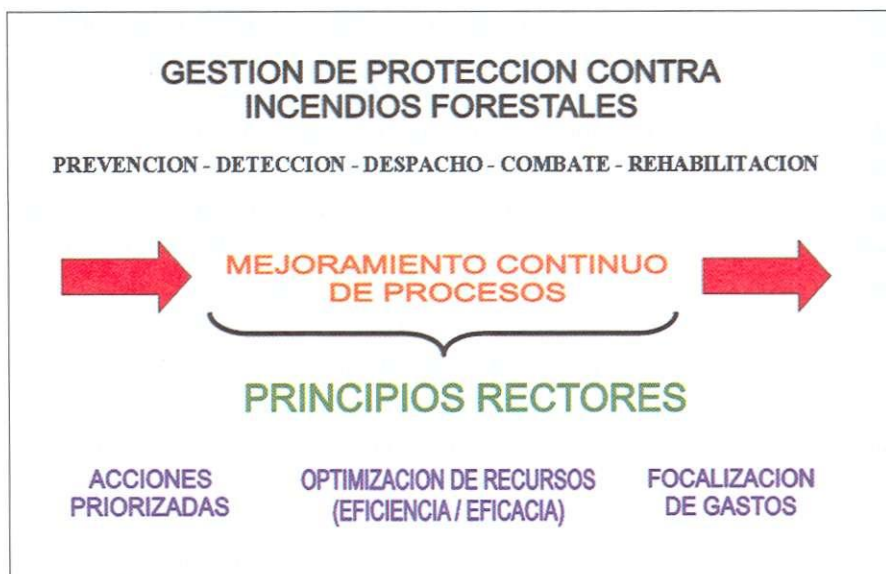
Figura 16.3. Principios rectores de manejo del fuego.

La gestión institucional, por tanto, enfrenta un entorno cada vez más exigente y competitivo, y requiere reforzar el servicio que entrega a la comunidad en términos de eficiencia, eficacia y calidad. Por esta razón, CONAF Región del Bío Bío, en los últimos años, ha impulsado acciones tendientes a mejorar la gestión de Protección contra incendios forestales, considerando como principios rectores la optimización de recursos, la priorización de acciones hacia las áreas de mayor impacto y la focalización del gasto (Figura 16.3).