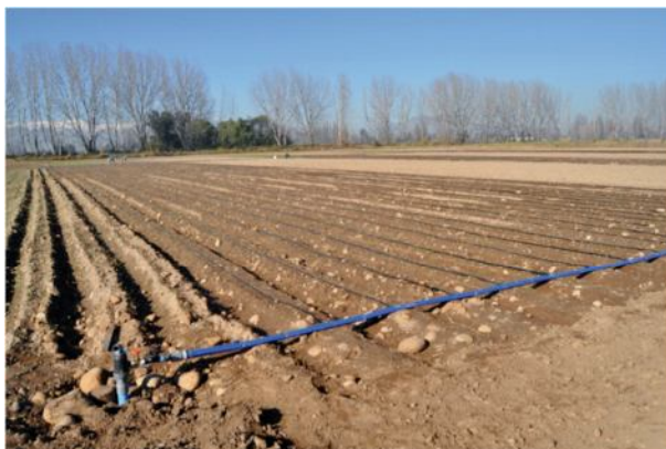
Figura 9. Sistema de riego por cintas sobre camas con agua tratada con luz UV-C.

En el caso que el agua no sea tratada con radiación UV, ésta es conducida directamente a la matriz de riego una vez que ha sido filtrada, derivando a los distintos sectores que involucra el sistema productivo, tal como se observa en la Figuras 9 ,10 y 11 .