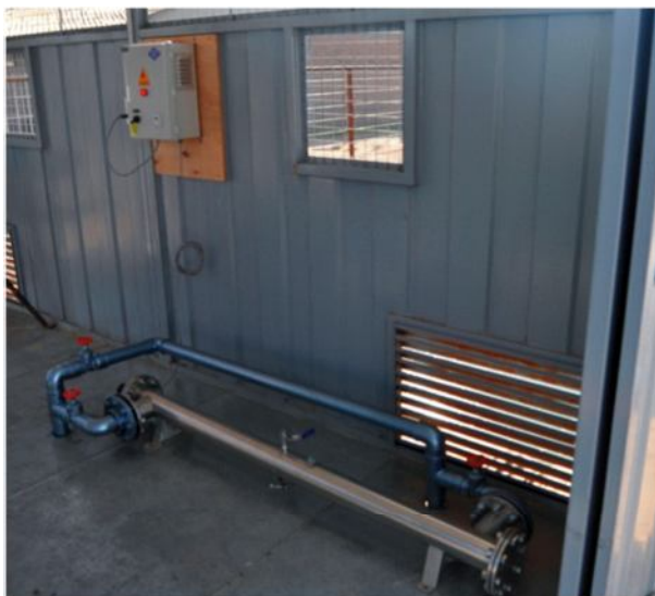
Figura 8. Lámpara emisora de rayos UV-C a 254 nm.

En el caso que el agua debe ser tratada con el sistema de desinfección UV, ésta debe ser conducida posterior al filtrado con anillas al filtro de desinfección ultravioleta (UV). El filtro de desinfección UV consiste en un tubo de acero inoxidable en cuyo interior se instala una lámpara continua de 300 watts, que emite una luz UV de 254 nanómetros de longitud de onda, y que produce el efecto germinicida y una máxima eficiencia ( Figura 8 ). La luz UV es capaz de actuar a nivel de ADN, destruyendo los ácidos nucleicos de las bacterias, impidiendo su viabilidad. La lámpara tiene una vida útil estimada de 16 mil horas, que