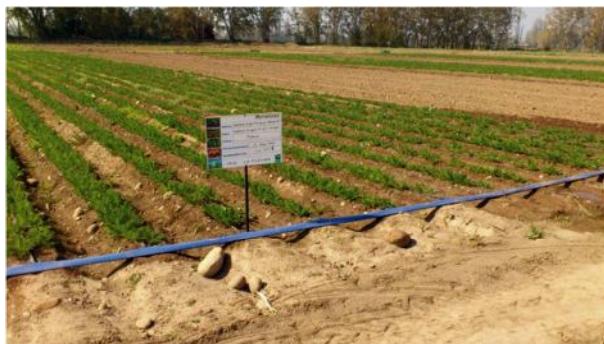
Figura 10. Cultivo de zanahorias regadas con agua tratada con luz UV-C.