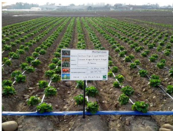
Figura 11. Cultivo de lechuga regado con agua tratada con luz UV-C.