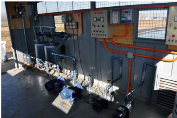
Figura 7. Caseta de control, bombas y filtros.