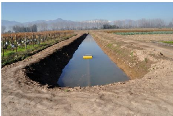
Figura 5. Desarenador de agua de riego de canal.

Del análisis de las variables anteriores, se diseñó un desarenador de 80 m de largo, 2,5 m de ancho a la entrada y al final (para facilitar la limpieza), lo cual otorga un área espejo de agua de 200 m 2 ( Figura 5 ). El tiempo de retención que se requiere es de 16 horas aproximadamente. Las dimensiones consideradas para la corona fueron de 1 m de ancho. Los taludes fueron 1:1 ó 45°. Esto equivale que por cada metro de elevación, el muro se desplaza un metro. La revancha o distancia del agua al borde del muro consideró un mínimo de 30 cm.