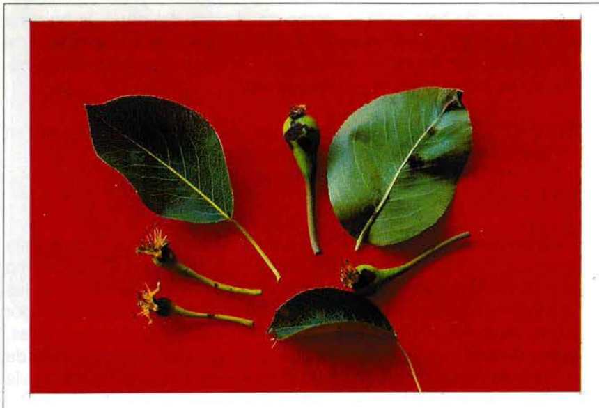
Foto 1. Hoja y frutos inmaduros de peral con daño causado por Pseudomonas syringae.

Los sépalos, pedicelos y receptáculos infectados presentan manchas irregulares de aspecto acuoso y coloración café. En ataques intensos puede ocurrir la muerte del ramillete floral completo. Cuando la infección comienza en los nectarios, al interior del receptáculo, los síntomas de marchitamiento y necrosis de las flores pueden confundirse con desórdenes provocados por una deficiencia de boro. La verdadera causa del problema sólo puede conocerse determinando la concentración de boro en las hojas y aislando la bacteria.