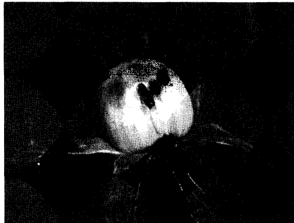
FIGURA 5. Lesiones lateral y basal sobre la nuez, causadas por bacteriosis del avellano europeo.