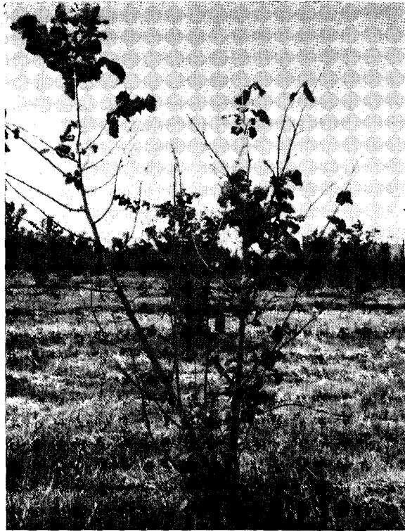
FIGURA 1. Avelano europeo joven, severamente afectado por tizón bacterial.