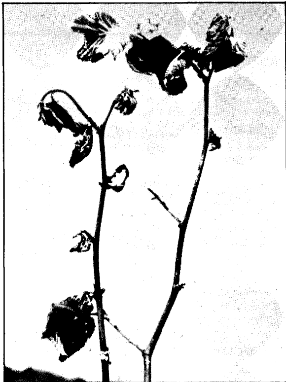
FIGURA 3. Ramas de avellano europeo. Atizonamiento de hojas y yemas y ramillas recién emergidas, muertas por la bacteriosis.