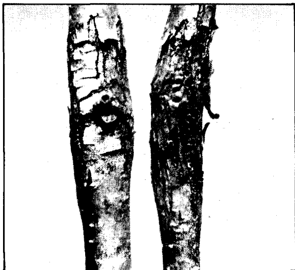
FIGURA 4. Cancros causados por la bacteriosis sobre ramas de más de dos años, en avellano europeo.

Las bacterias procedentes de Temuco y de Lanco, quedaron registrada en el C.M.I. bajo los números B 11422 y B 11688, respectivamente. El informe del C.M.I. indica, además, que no se tenían antecedentes de la bacteria, tanto de Chile como de Sud América.