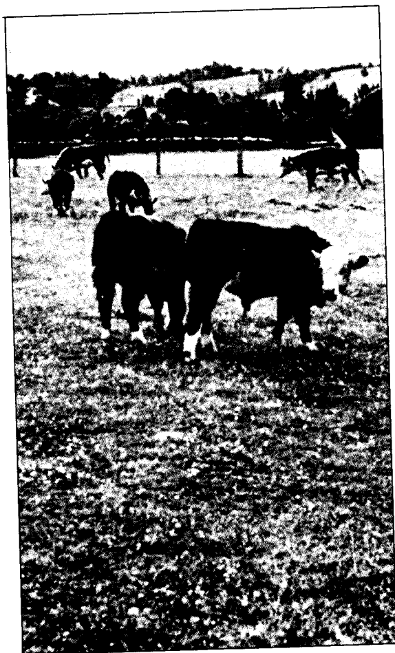
Torestes Hereford a pastoreo.

En la medida que el productor especializado en carne bovina resuelva sus problemas de alimentación, sanidad y manejo, va a tener la necesidad de mejorar la eficiencia de sus animales. Para esto, la herramienta fundamental es la selección, la cual hace uso del material genético para lograr terneros precoces (peso de beneficio a edad temprana) y de buena condición muscular (relación músculo/grasa).