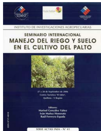
Serie Actas INIA: información de cursos, seminarios, simposios, congresos y talleres.

Publicaciones que contienen las presentaciones de los expositores en cursos, seminarios,