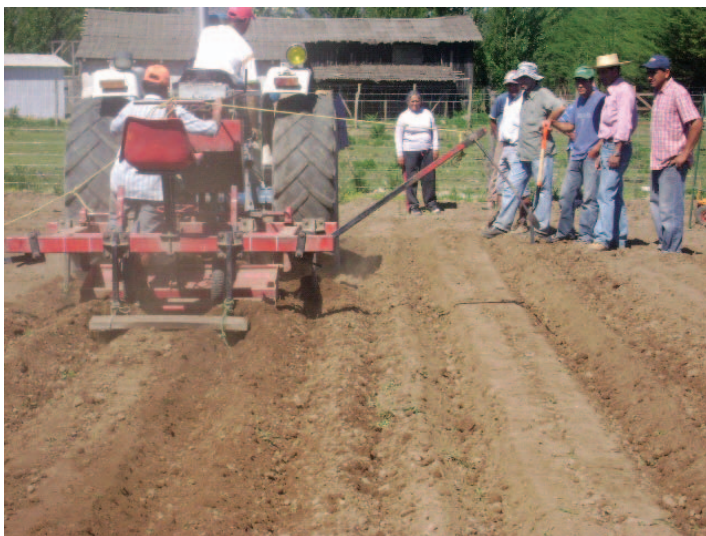
Preparación de las platabandas para el transplante del melón.