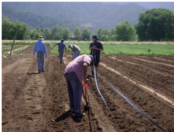
Instalación de las cintas para el riego por goteo.

Ensayo realizado en la comuna de La Cabras demostró que el riego por goteo potencialmente puede llegar a cuadruplicar el margen bruto del cultivo del melón en pequeños agricultores de la Región de O'Higgins.