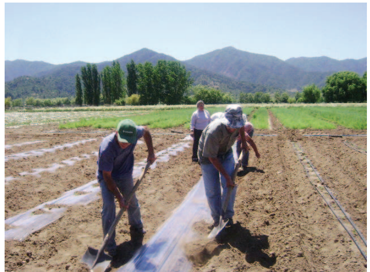
Colocación de la cubierta de mulch transparente.