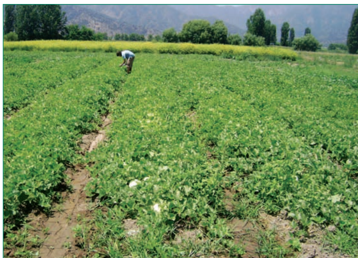
Desarrollo del cultivo del melón.