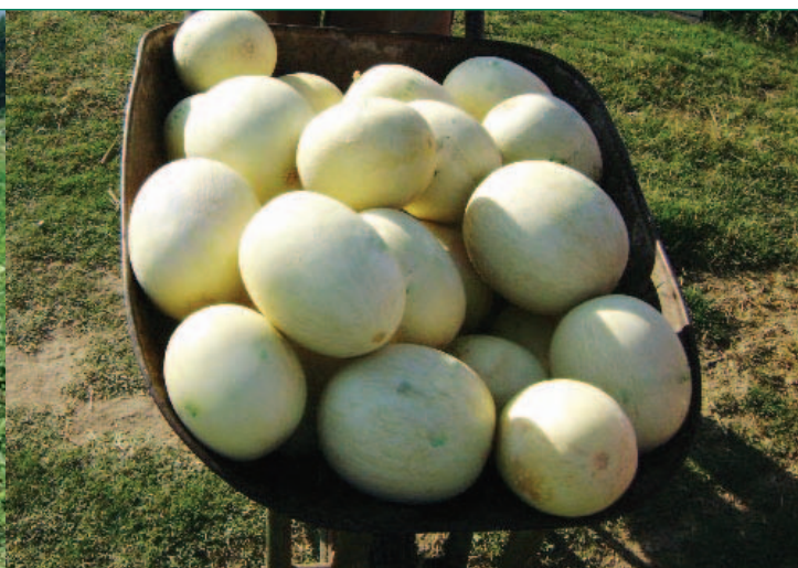
Cosecha de melones del ensayo.