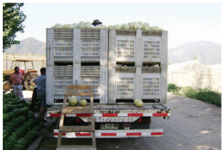
Acopio y transporte de melones cosechados en el predio.