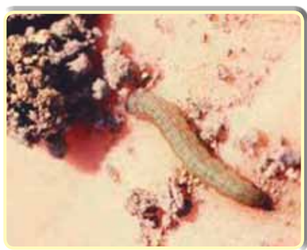
Foto 7.32. Larva de E. angustellus