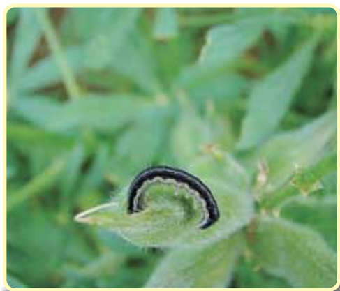
Foto 7.13. Cuncunilla horadando vaina de lupino