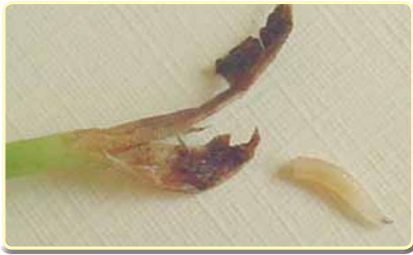
Foto 7.1. Larva de Delia

Insectos cosmopolitas. En Chile, la distribución de Delia antiqua abarca desde la Región de Valparaíso a la de Magallanes y Delia platura desde la Región de Coquimbo a la de Los Lagos, incluido el Archipiélago Juan Fernández. Hospederos, además del lupino: ajo, alcayota, arveja, betarraga, camote, cebolla, cebollín, chalota, espárrago, espinaca, haba, maíz, melón, papa, poroto, rábano, sandía, trébol, zanahoria, zapallo.