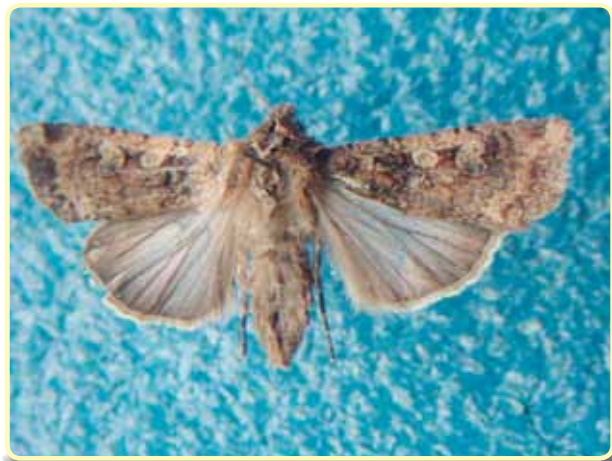
Foto 7.11. Copitarsia , ejemplar adulto