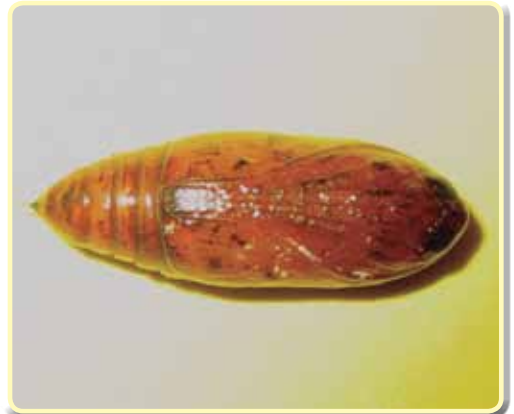
Foto 7.10. Pupa de Copitarsia