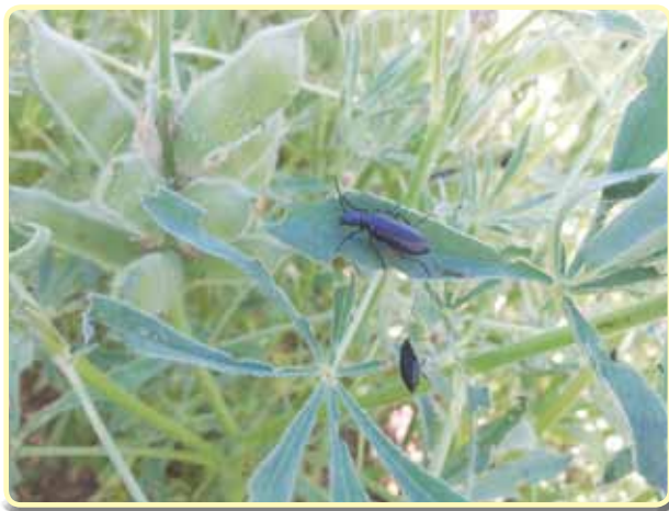
Foto 7.28. Pilmes consumiendo hojas de lupino amarillo