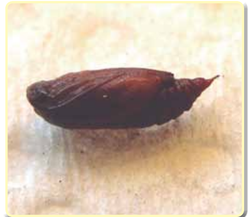
Foto 7.5. Pupa de gusano cortador