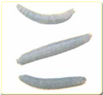
Foto 7.38. Larvas del zancudo patón del trigo

Presente entre las regiones de Valparaíso y Los Lagos. Hospederos, además del lupino: haba, lenteja, trigo, peonía, praderas. El adulto tiene la apariencia de un zancudo con patas muy largas. El cuerpo de los machos mide 1 cm de largo, en promedio. Cabeza grisácea con ojos prominentes; antenas más largas que el ancho de la cabeza. Tórax gris con manchas castañas alargadas; halterios muy visibles; alas hialinas con venas longitudinales oscuras destacables con una mancha angosta en el borde anterior de las mismas. Patas largas con tarsos oscuros. Abdomen delgado pero ensanchado en el sector medio. Las hembras, con alas como muñones, tienen el cuerpo más largo que el macho y colocan huevos parcialmente enterrados en el suelo, de preferencia en lugares húmedos. Nueve días después de la postura emergen larvas grises o negruzcas, ápodas, que se alimentan de raíces hasta alcanzar 2,5 cm de largo en unos 60 días. Luego de 15 días como pupa los adultos emergen del suelo. Los machos vuelan de septiembre a octubre. Durante el año pueden sucederse dos generaciones, dependiendo de las condiciones del medio. No hay registros de enemigos naturales, aunque podrían serlo aves, mamíferos insectívoros y carábidos entomófagos.