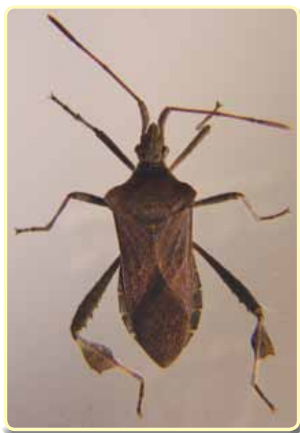
Foto 7.29. Leptoglossus chilensis , ejemplar adulto

Sus enemigos naturales son las moscas taquínidas Hyalomyia chilensis Macquart y una avispa del género Hadronotus (Hymenoptera:Scelionidae)