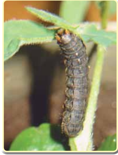
Foto 7.8. Larva de Copitarsia