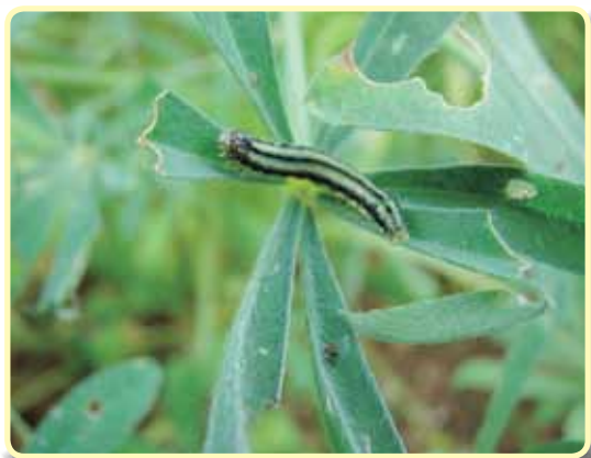
Foto 7.12. Cuncunilla consumiendo hojas de lupino