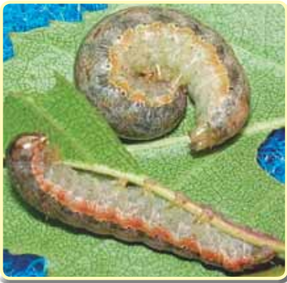
Foto 7.9. Larvas de Copitarsia