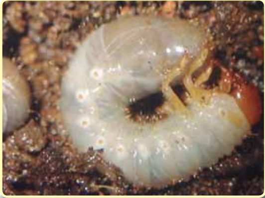
Foto 7.26. Gusano blanco, Hylamorpha elegans

Habita desde las regiones del Maule a Los Lagos. Hospederos, además del lupino: abedul, acacia, achicoria, alfilerillo, arándano, arvejilla, avellano europeo, avenilla, avena, ballica, cerezo, cebada, centeno, coihue, cola de zorro, chamico, diente de león, duraznillo, frambueso, fresno, fromental, hierba del chancho, hualputra, murtilla, pasto miel, pato ovilla, peonía, raps, raulí, roble, siete venas, tréboles, trigo.