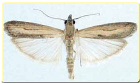
Foto 7.31. Elasmopalpus angustellus , ejemplar adulto