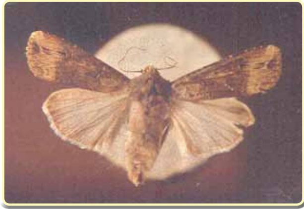
Foto 7.6. Agrotis ipsilon , ejemplar adulto

En Chile sus antagonistas son Architas cirphis Curran, Bonnetia compta (Fallen), Carcelia formosa (Aldrich & Webber), Chaetogaedia monticola (Bigot), Eucelatoria armigera (Coquillet), Euphorocera claripennis (Macquart), Gonia longipulvilli Tothill, Gonia sequax (Williston), Lespesia archippivora (Riley), Madremyia saundersii (Willoston), Sysiropa eudryae (Townsend), Tachinomyia panaetius (Walker), Prosopochaeta fidelis (Reinhard) (Diptera: Tachinidae); Apanteles bourquini (Blanchard), Macrocentrus collaris (Spinola); Meteorus rubens (Nees) (Hymenoptera: Braconidae); Amblyteles sp., Ophion sp. (Hymenoptera: Ichneumonidae). Es frecuente la aparición de gusanos cortadores en siembras de lupino que siguen a trébol rosado. Removiendo el suelo alrededor de plantas recién cortadas es posible confirmar la presencia de la larva.