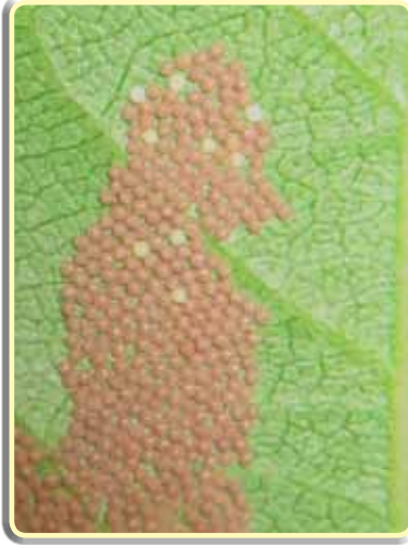
Foto 7.7. Huevos de Copitarsia