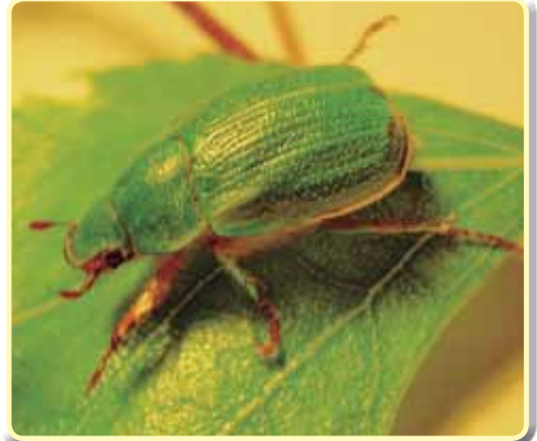
Foto 7.27. Hylamorpha elegans , ejemplar adulto

La larva es llamada gusano blanco, que forma la letra C cuando está en reposo. El adulto mide 1,5 a 1,8 cm de largo y 0,8 cm de ancho. Dorso verde brillante con escasa pilosidad blanca. Cabeza verde con reborde oscuro en el sector anterior; antenas café claro. Tórax verde, del mismo color que la cabeza. Élitros verdes con leve tono dorado en el sector humeral y también en el sector posterior. Patas verdes con dorado y pelos blancos; las hembras con patas anteriores más oscuras, café y dentadas. Parte ventral del cuerpo con pilosidad blanca. Los adultos se congregan en robles o hualles para alimentarse y aparearse. En la zona sur los vuelos importantes ocurren de diciembre a segunda semana de enero. Las hembras fecundadas vuelan al crepúsculo y anochecer para colocar huevos redondos lisos, blanco cremosos, de 2 mm de diámetro, algo brillantes, enterrados a 5 cm bajo la superficie del suelo. Eclosionan 15 a 25 días después de la postura. Las larvas tienen cuerpo plumizo, algo transparente y abultado en su extremo posterior, con pelos ralos y castaños, cabeza café expuesta, notoria, con fuertes mandíbulas, patas blancas con pelos. Se alimentan de raíces y viven bajo suelo hasta noviembre, cuando pupan. La pupa es ovalada, de 2 cm de largo, castaño clara, con exuvio larval cubriendo parcialmente su cuerpo. El período pupal dura alrededor de 28 días, luego los adultos emergen del suelo para reiniciar el ciclo, que dura un año.