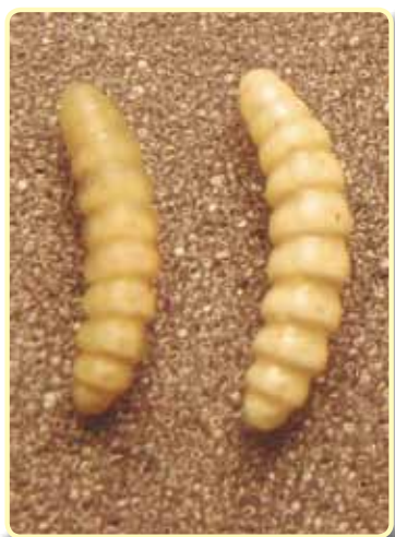
Foto 7.33. Larvas de Chiromyza paulseni

Distribuida entre las regiones del Maule y Los Lagos. Hospederos, además del lupino: arándano, ballica, chéptica, festuca, pasto cebolla, pasto ovillo, peonía, raps, trigo. Adultos de aproximadamente 0,9 cm de largo, amarillentos oscuros. Cabeza más ancha que el tórax; ojos compuestos grandes y los simples rojizos. Antenas de tres segmentos cortas y negras. Tórax con algunas cerdas cortas amarillentas. Alas ahumadas y más oscuras en la base. Patas largas, del mismo color del tórax. Abdomen algo más claro. Los adultos vuelan en febrero y marzo y son fáciles de coger con la mano, por ello el nombre “moscas tontas”. Las hembras pueden poner en el suelo, cerca de los tallos, hasta 150 huevos blancos de 0,1 cm de largo, algo curvados y fusiformes, en grupos de hasta 25. Larva vermiforme, alargada, amarillo oscura a café, de aspecto cuerudo; el extremo anterior con tres puntas esclerosadas. Las larvas eclosionan en marzo y consumen raicillas y raíces hasta el verano. Pupa café, segmentada y dura; se encuentra en el suelo desde mediados de enero a mediados de marzo. Luego emergen moscas adultas para reanudar su ciclo anual. Las aves insectívoras ejercen buen control de larvas, destacándose queltehues y bandurrias. No se registran insectos entomófagos.