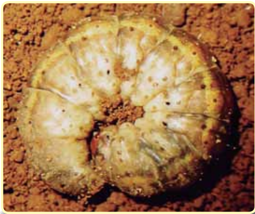
Foto 7.4. Gusano cortador

El estado adulto del gusano cortador de las chacras es una mariposa de 3 a 5 cm de ancho con alas extendidas. Cabeza gris oscura con antenas filiformes. Tórax oscuro. Alas anteriores castaño oscuras, con el tercio apical más claro; alas posteriores más claras que las anteriores y con notoria venación. Abdomen piloso, más claro que el tórax. La larva plenamente desarrollada alcanza 4,5 cm de largo. Su cabeza es café rojiza y el cuerpo gris, opaco, de aspecto grasoso, con una línea media dorsal amarillenta y dos bandas laterales menos notorias, sector ventral verdoso amarillento. Se enrosca cuando es molestada. Pupa café, desnuda, obtecta. La mariposa adulta pone huevos blancos, dispersos en el suelo o en hojas. Las larvas nacen a los 5 a 10 días y se introducen en el suelo. Salen solo de noche para cortar el cuello de plántulas y plantas jóvenes. Suelen comer raíces. El estado larvario dura alrededor de 25 días y se puede extender a más de un mes con baja temperatura. El estado de pupa o crisálida dura 15 días para dar paso al adulto. Durante el año puede tener 3 a 5 generaciones.