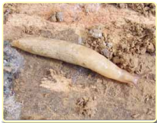
Foto 7.24. Deroceras reticulatum , ejemplar adulto