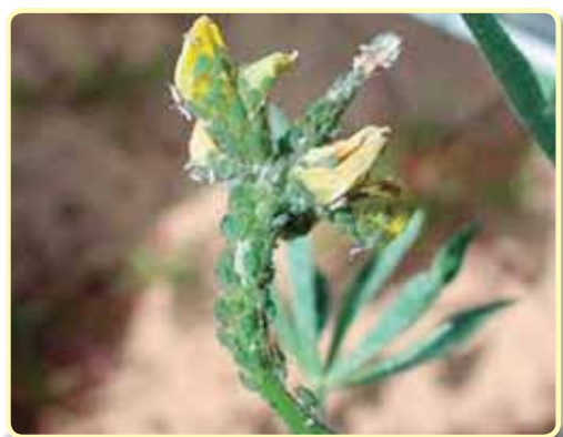
Foto 7.22. Pulgón azul de la alfalfa ( Acyrtosiphon kondoi ) atacando lupino amarillo en Australia

Si su población llegara a justificarlo, se recomienda utilizar insecticidas sistémicos fosforados (dimetoato), carbamatos (pirimicarb) o neonicotenoides (acetamiprid, thiometoxam).