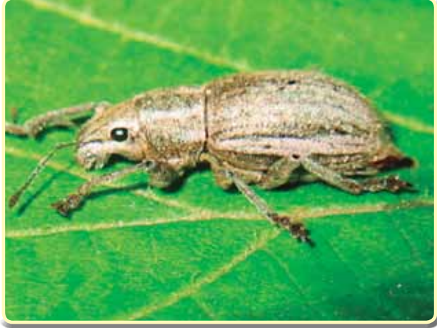
Foto 7.30. Naupactus leucoloma , ejemplar adulto

blanco cremoso, algo piloso. Su cabeza es retraída y solo se distinguen sus mandíbulas café esclerotizadas. No posee patas y se alimenta de raíces durante otoño, invierno y parte del verano. Pupa también blanca cremosa y subterránea. En verano emergen del suelo los adultos, todas hembras, que suben al follaje para alimentarse. El ciclo vital dura hasta 18 meses. No se tiene registro de entomófagos.