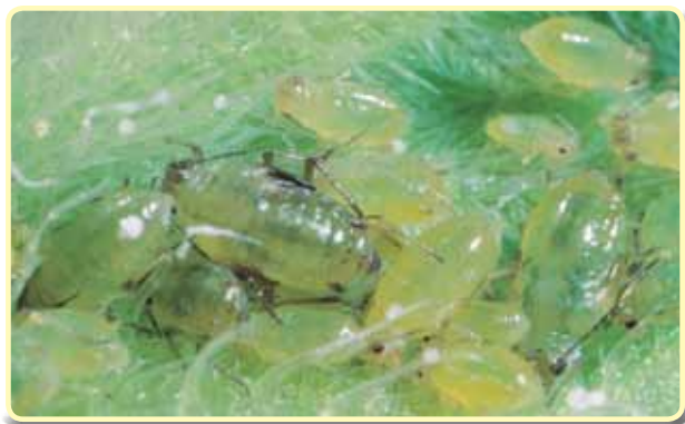
Foto 7.21. Brachycaudus helichrysi , ejemplares no alados

Insecto cosmopolita, presente prácticamente en todos los continentes. En Chile se encuentra entre las regiones de Atacama a Los Lagos. Hospederos, además del lupino: alfalfa, cineraria, ciruelo, crisantemo, duraznero, maravilla, ortiga, papa, pistacho, poroto, senecio, tajete, tomate.