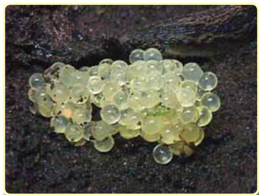
Foto 7.25. Huevos de babosa