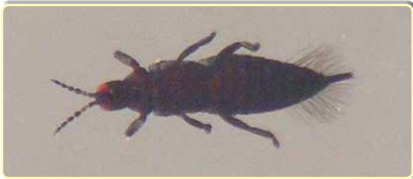
Foto 7.37. Frankliniella australis , ejemplar adulto

se encuentran en el fondo de las flores. Inverna como hembra adulta en malezas. Los ejemplares que se encuentran en flores de plantas cultivadas no causan daños, pero en algunos cultivos son plaga cuarentenaria. No se tiene registro de enemigos naturales.