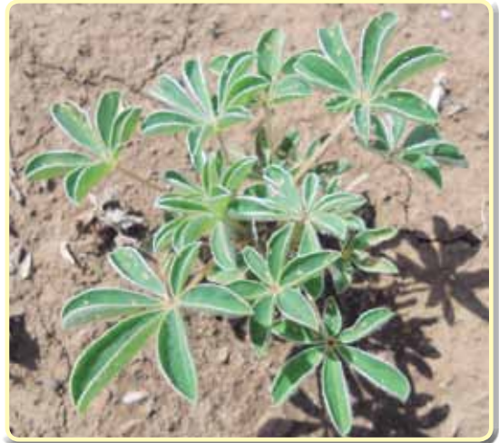
Foto 7.20. Daño de pulga saltona en lupino albus

Los adultos son pequeños (2 a 3 mm de largo), sin alas, de cuerpo blando globoso, deprimido lateralmente, amarillo verdoso. Cabeza dirigida hacia abajo, con grandes ojos negros y aparato bucal masticador. Antenas largas de cuatro segmentos. Segmentos torácicos reducidos. Patas largas, delgadas, terminadas en una uña negra. Saltan gracias a una estructura ventral denominada furca. Abdomen globoso con pelos cortos y una papila anal. Huevos amarillo pálido; las hembras los colocan en el suelo, prefiriendo lugares húmedos con abundante materia orgánica. Eclosionan entre 8 a 20 días, según la temperatura ambiental. Ninfas similares a los adultos; alcanzan adultez en alrededor de 60 días. La pulga saltona consume los bordes de las hojas, dejando una película translúcida. La literatura nacional no menciona enemigos naturales de la pulga saltona en la alfalfa.