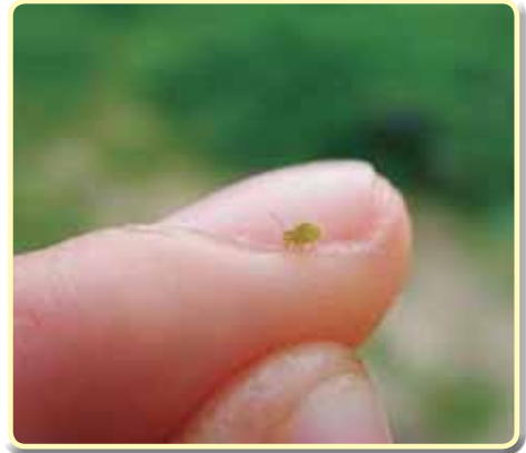
Foto 7.18. Sminthurus , tamaño del adulto