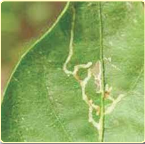
Foto 7.35. Daño de la larva de Liriomyza huidobrensis

Presente desde la Región de Arica y Parinacota a la de Aysén. También en Isla de Pascua y el Archipiélago de Juan Fernández. Hospederos, además del lupino: acelga, alcachofa, alfalfa, apio, arveja, betarraga, cebolla, cilantro, clavel, coliflor, espinaca, galega, habas, lechuga, lenteja, lino, melón, palqui, papa, pimentón poroto, remolacha, repollo, tabaco, tomate, trébol y varias plantas ornamentales. Los adultos son moscas negras pequeñas, 2 mm de largo, con manchas amarillas en la cabeza, ojos rojizos. Tórax negro con máculas amarillas en el dorso y costados; balancines amarillos; alas algo ahumadas con venas oscuras. Las hembras colocan huevos blancos insertos en las hojas. Larvas blancas, ápodas, nacen a los 8 días y durante dos semanas dañan las plantas haciendo galerías en el parénquima de las hojas. Pupan en el suelo 10 días y luego salen las moscas adultas. Su ciclo puede repetirse varias veces al año, en diferentes hospederos. Tiene como enemigos naturales a varios himenópteros.