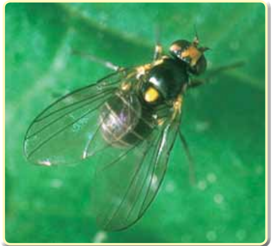
Foto 7.36. Liriomyza huidobrensis , ejemplar adulto