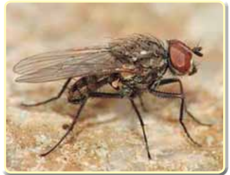
Foto 7.3. Delia , ejemplar adulto

Adultos parecidos a la mosca doméstica, pero más pequeños (4 a 6 mm de largo), esbeltos y con patas más largas. Son grises con tonalidades verdosas. Ojos anaranjados, juntos en los ejemplares machos y separados en las hembras. Antenas negras. Tórax gris con manchas negras. Abdomen delgado. La diferencia entre adultos de D. antiqua y D. platura se evidencia en el tórax. D. antiqua tiene cuatro bandas longitudinales oscuras difusas y cuatro hileras de cerdas; en D. platura no se distinguen bandas en el tórax y las cerdas son escasas. Huevos alargados, blanco amarillentos. La hembra los deposita en el suelo, preferentemente en aquellos con abundancia de materia orgánica, ubicándolos cerca de semillas o tallos emergentes. A los 5 días emerge la larva e inmediatamente se introduce a la semilla o tallos, construyendo galerías. El período larvario es de 4 semanas en promedio. Las larvas plenamente desarrolladas miden más de 2 mm. El insecto pupa enterrado en el suelo a 5 cm y después de 15 días emerge el adulto. Durante el año pueden sucederse