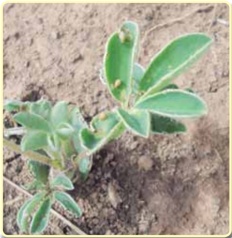
Foto 7.19. Pulga saltona en lupino albus