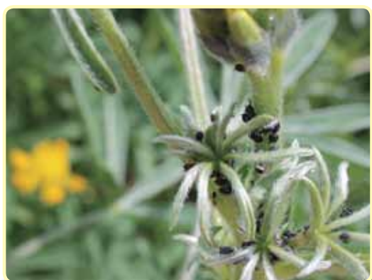
Foto 7.23. Pulgón negro de la alfalfa ( Aphis craccivora ) en lupino amarillo