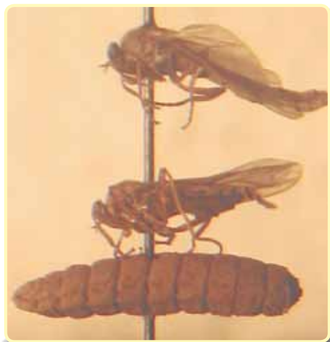
Foto 7.34. Chiromyza paulseni , ejemplares adultos y una pupa