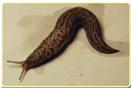
Foto 7.40. Limax maximus , ejemplar adulto

La babosa parda por ahora está determinada para las regiones del Bio Bío a Los Lagos. Hospederos, además del lupino: arándano, malezas de hoja ancha, raps. Mide 2,5 cm de largo. Cuerpo más esbelto que la babosa gris y su manto marrón claro está situado cerca de la mitad de su cuerpo café con una línea clara en el dorso. Tiene los mismos hábitos de vida que la babosa gris y pueden convivir en el mismo territorio. En Chile no se tiene registro de enemigos naturales.