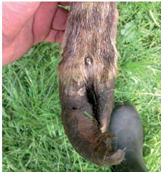
Figura 1. Pezuña con sobrecrecimiento.

la presencia de cuerpos extraños en esas separaciones producidas o la contaminación por fecas y barro, las cuales pueden llevar a la generación de un absceso debido a la contaminación bacteriana (Figura 2).