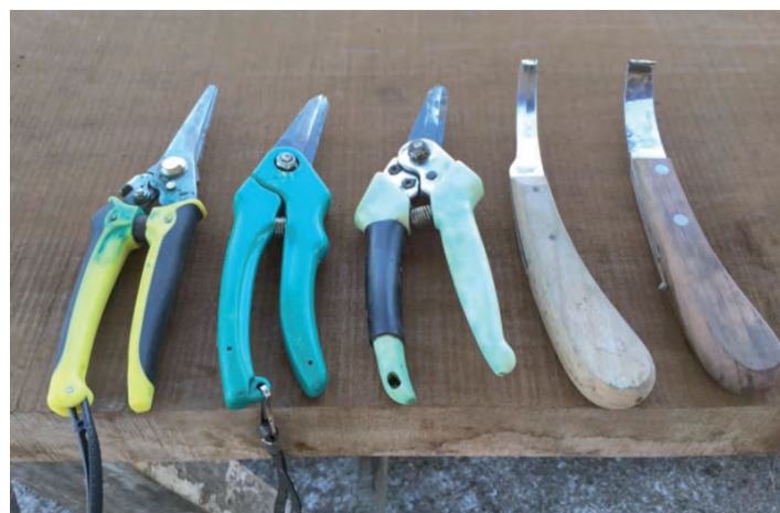
Figura 4. Despalmadores para ovinos.

Es muy importante mantener la limpieza en las zonas de alojamiento del rebaño, para reducir la humedad en las pezuñas y de esta manera no predisponer a las distintas enfermedades anteriormente descritas. El despalme preventivo debe realizarse 2 veces al año (pre encaste y en la