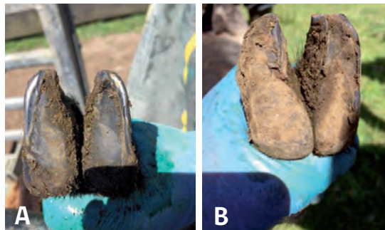
Figura 2: Línea blanca sin alteración (A). Enfermedad de la línea blanca con separación y pérdida de continuidad (B).

la presencia de cuerpos extraños en esas separaciones producidas o la contaminación por fecas y barro, las cuales pueden llevar a la generación de un absceso debido a la contaminación bacteriana (Figura 2).