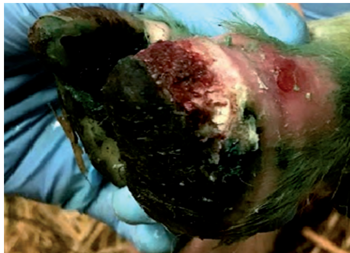
Figura 3: Dedo lateral con Footrot

esquila). Este debe realizarse preferentemente con una tijera o despalmadores diseñados para este fin (Figura 4), respetando la anatomía de la pezuña y la relación muralla/talón (2:1) (Figura 5) y aplicando algún endurecedor de pezuña.