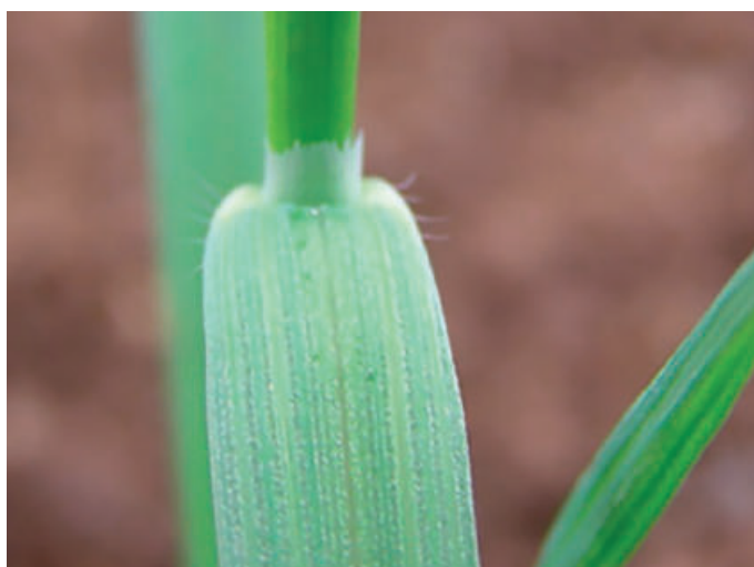
Foto 1. Parte de la lámina de la hoja (ciliada en su base) y lígula.

germinar (profundidades mayores a 25 cm). Esta práctica debe utilizarse con precaución, ya que a largo plazo se va produciendo una distribución homogénea en el perfil del suelo, al compensarse el enterrado de semillas nuevas con el desplazamiento de semillas viejas a la superficie.