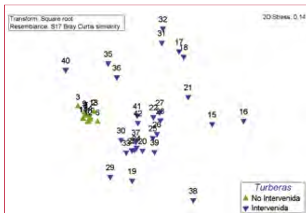
Figura 3. Ordenación nMDS de las parcelas de muestreo en una turbera no cosechada y una cosechada, en el sector de Río Rubens.

Otro factor importante de considerar es la contaminación de la turba cosechada con semillas de especies exóticas invasoras, su presencia podría convertirse en un obstáculo para la comercialización de algunos productos agropecuarios derivados de la turba, como son los sustratos comerciales. En este sentido, se deben evaluar estrategias de manejo destinadas al control de especies exóticas, asociadas a la actividad extractiva de turba.