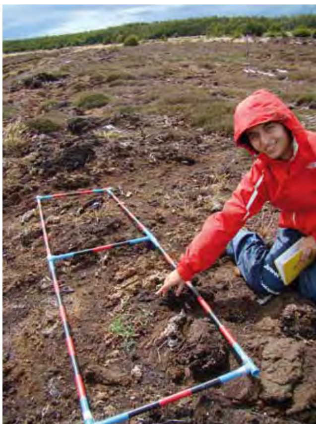
Figura 2. Hieracium pilosella , una especie exótica invasora primer reporte de su presencia en una turbera abandonada en la Región de Magallanes.

en una turbera de Sphagnum que presenta modificaciones producto de la explotación de turba ocurrida en el pasado, la que tiene 10 años de abandono, y una condición de no intervención.