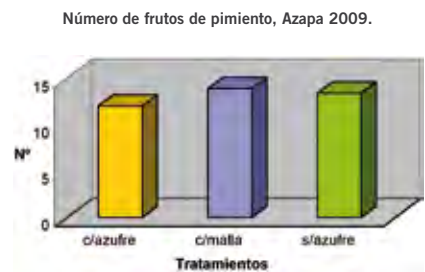
Figura 5. Número de frutos de pimienta con tres tratamientos de protección del cultivo, Azapa 2009.