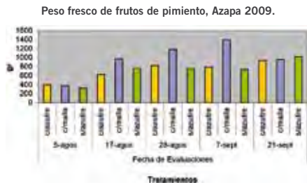
Figura 1. Peso fresco de frutos de pimienta para 5 fechas de muestreo, y tres tratamientos de protección del cultivo, Azapa 2009.

► El uso de azufre en polvo no afectó significativamente ninguno de los parámetros evaluados y en muchos casos fue igual que no aplicar el producto.