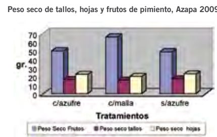
Figura 6. Peso seco de tallos, hojas y frutos de pimienta con tres tratamientos de protección del cultivo, Azapa 2009.