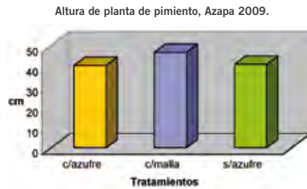
Figura 3. Altura de plantas de pimienta con tres tratamientos de protección del cultivo, Azapa 2009.

Para evitar el contagio temprano de insectos chupadores (mosquitas blancas y pulgones), se llevó a cabo un tratamiento preventivo a todos los almácigos, antes del transplante. El tratamiento consistió en sumergir las plántulas, dispuestas en las bandejas, en una solución con el ingrediente activo Imidacloprid (Confidor 350 SC en dosis de 60 cc por 100 litros de agua).