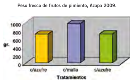
Figura 4. Peso de frutos de pimienta con tres tratamientos de protección del cultivo, Azapa 2009.