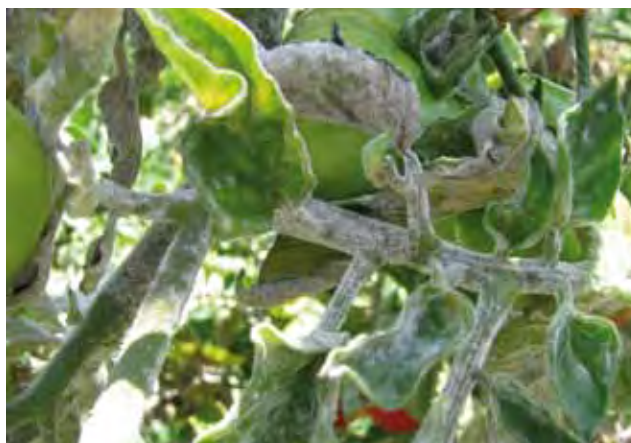
Foto 1. Síntomas de oídio en pimientos.

Centro de Investigación Especializado en Agricultura del Desierto y Altiplano (CIE) INIA-URURI