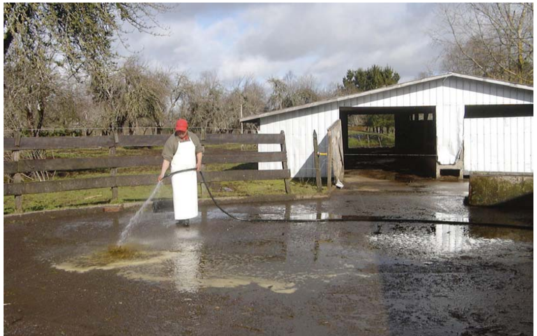
El uso de grandes volúmenes de agua limpia para lavado de pisos es una práctica común en predios lecheros, que debe ser evitada.

La producción limpia es una estrategia de gestión ambiental preventiva, que reduce riesgos para la salud humana, minimiza la contaminación, eleva la competitividad de la empresa y construye un camino viable para el cumplimiento de normas actuales y futuras. El Consejo Nacional de