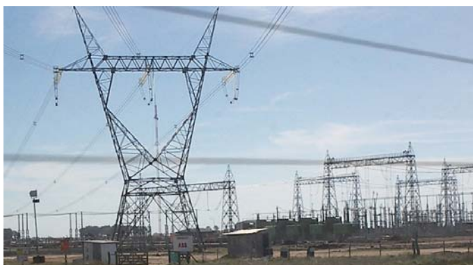
Otro aspecto clave en el cual hay que mejorar sustancialmente la eficiencia es en el uso de la energía.

Se pudo determinar que el manejo de efluentes lecheros, constituido principalmente por fecas, orina, aguas sucias del lavado de equipo de ordeña y pisos (ver foto), constituye uno de los puntos de mayor importancia a mejorar en los campos evaluados. En general los efluentes son muy diluidos, debido al gran ingreso de aguas de lluvia y de limpieza, aspecto que debiera ser mejorado. También existe un desconocimiento por parte de los productores