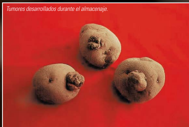
Tumores desarrollados durante el almacenaje.

Las distintas categorías de tubérculos fueron almacenadas en mallas, en una bodega con ventilación suficiente y luz difusa, en lo que se conoce como tratamiento de prebrotación. Bajo estas condiciones se evita la aparición de un solo brote (domi-