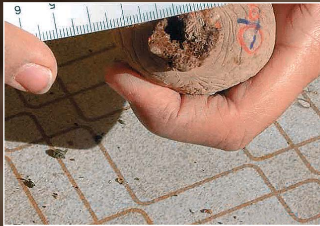
Medición de tumores.

Este último resultado es muy importante, por cuanto para sembrar una hectárea de papa se requiere de una cantidad aproximada de 40.000 a 45.000 tubérculos de calibre 35 a 45 mm. Si se efectúa una selección de "semilla" proveniente de un cultivo anterior de la 4ª Región, y se califica todos los tubérculos seleccionados como aparentemente sa-