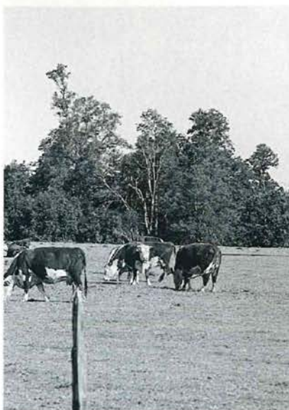
Si la disponibilidad de forraje es bajo, se debe adelantar el destete para no perjudicar a las madres.

Otro factor, también relacionado con la disponibilidad de forraje, es el estado de la vaca o condición corporal. Cuando la disponibilidad de la pradera es alta y el estado de la vaca es bueno, se dan las condiciones para poder atrasar el destete. Si la condición corporal de las vacas no es buena, conviene hacer el destete más temprano. Todo lo anterior debe estar relacionado con el manejo