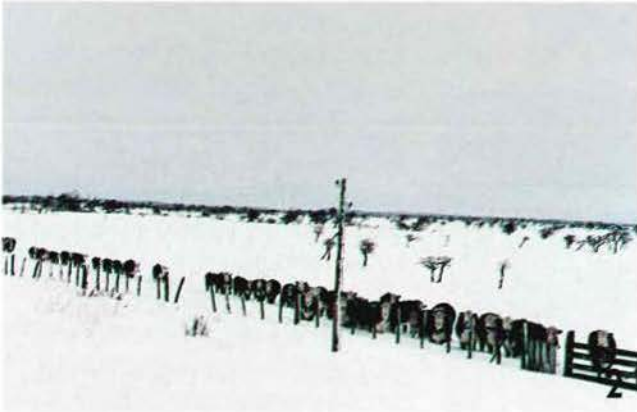
La variabilidad del clima tiene que ser considerada en el diseño de la estrategia de pastoreo. 1.- Aguada seca (veranada 1990). 2.- 80 días bajo nieve (invierno de 1995).

coironal, que ocupa más de la mitad de la Patagonia, la producción animal se sustenta en la escasa vegetación que crece entre el coirón, llamada cojín. El coirón es rechazado, mientras exista cojín, pero si es talajeado con frecuencia su capacidad de recuperación es muy débil y termina por desaparecer.