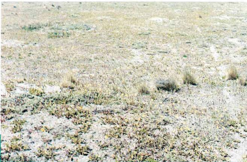
Lo que puede resultar en dominancia de malezas y aumento de suelo desnudo (2).

ble, no puede decirse que sea en sí mismo adecuado o inadecuado. A veces se puede modificar sustancialmente, otras no.