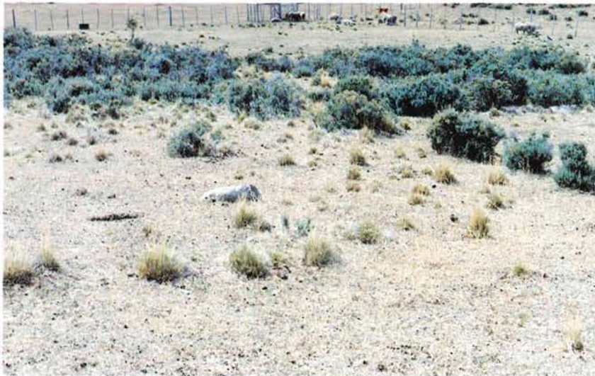
Los ovinos eliminan el cojín antes de consumir coirón (1).

Efecto de dos temporadas de corte a 7 cm de altura en la curva de disponibilidad de materia seca (m.s.) en un coironal en condición excelente y 2.350,25 kg de m.s./ha iniciales.