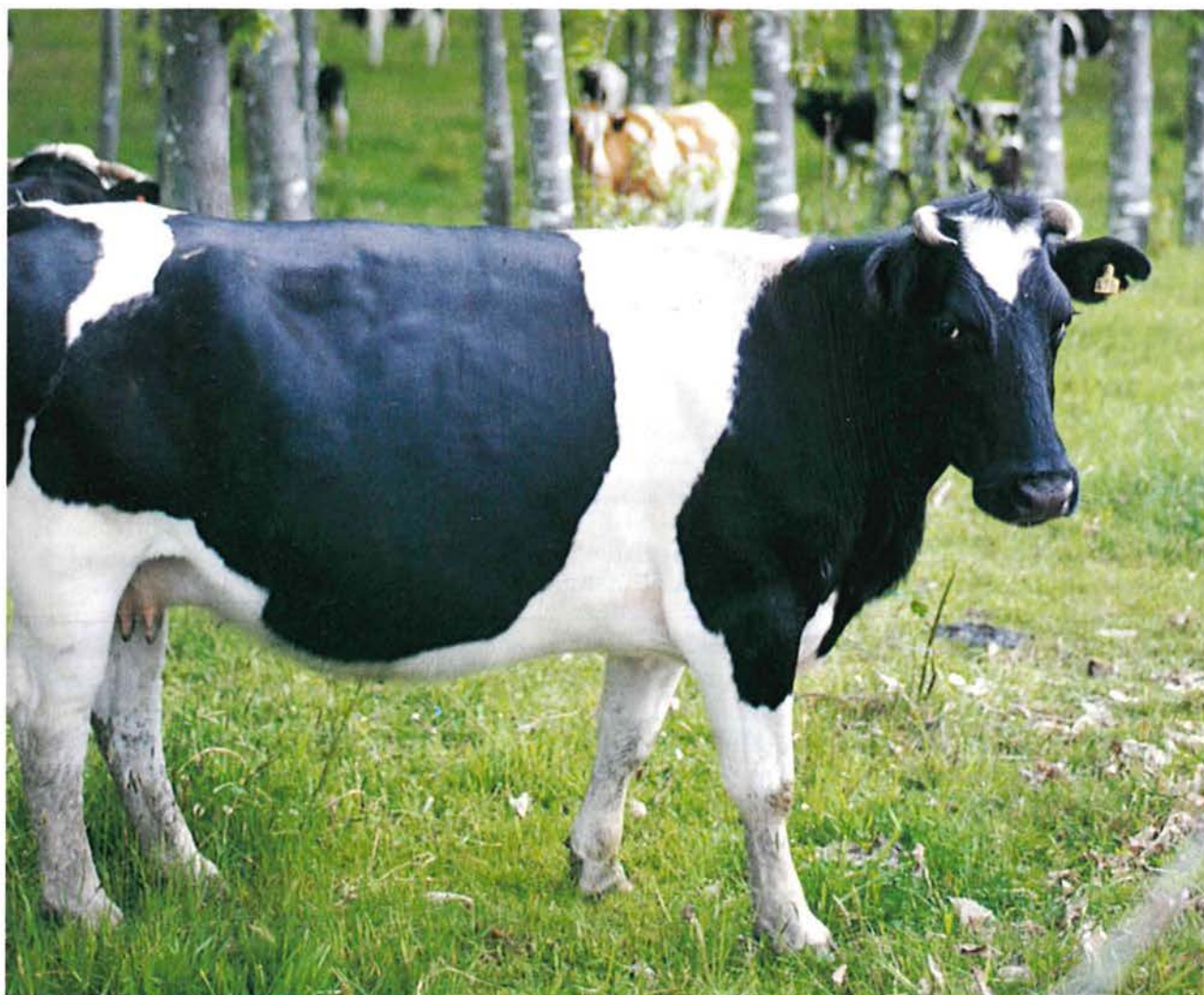
Los animales de la raza frisona tienen una mejor relación de cuarto posterior/cuarto anterior respecto a los genotipos Holstein.