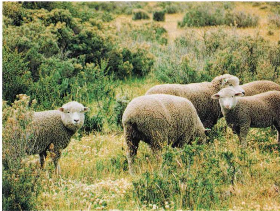
Oveja Corriedale con corderos cruce Dorset. También se observa un cordero Corriedale puro a la izquierda de la foto.

Como el valor comercial de la lana se pondera considerando kilo de vellón, finura y rendimiento al lavado, los valores encontrados se compensan tendiendo a igualarse al mostrar mayor rinde las borregas cruza que la pura Corriedale con la finura de esta última versus los cruzamientos y el peso del vellón. El precio final de la lana, considerado las variables citadas, no muestra diferencias de importancia económica. Lo anteriormente expresado es de relevancia, pues en una re-