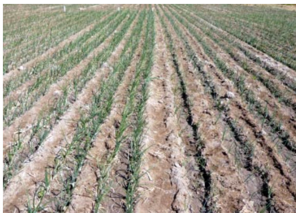
Foto 2. Contraste en ensayo de campo por uso de plantas con diámetros grandes (+ 4 mm), izquierda, versus plantas pequeñas (- 2 mm), derecha.

Cuadro 4. Rendimiento de cebolla, cv Texas Grano (mallas/ha) según categoría de la plántula. Valle de Lluta.