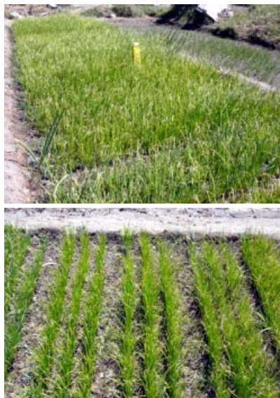
Foto 3. Almacigo de variedades establecido en km 52 del Valle de Lluta.

Este jardín de variedades se estableció en el predio del Sr. Efraín Blanco ubicada en el km 52 del Valle de Lluta, sector de Tocontasi ( Foto 3 ).