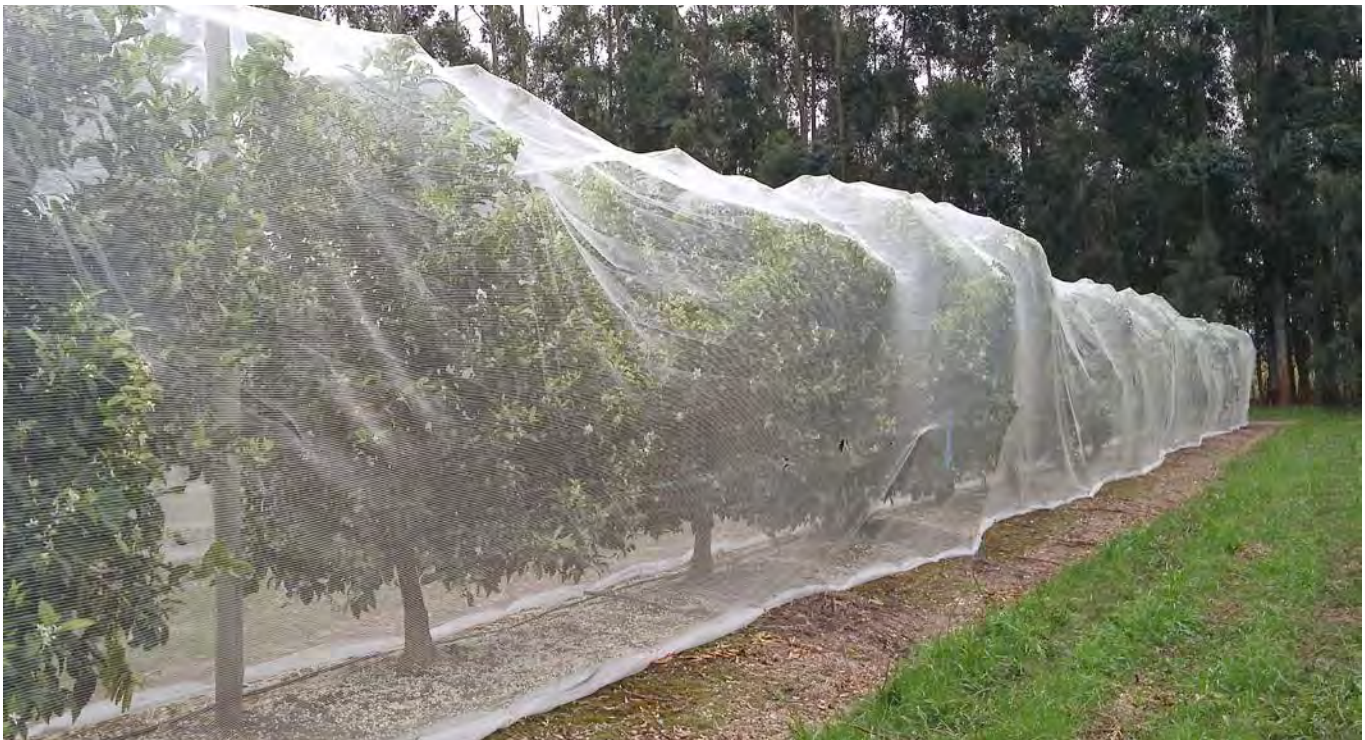
Figura 1. Vista de mallas antiabejas colocadas en mandarina 'Afourer' durante el período de floración, Experimento 2.

En ambos experimentos, se marcaron 10 plantas en condiciones de libre polinización a las que se les realizaron