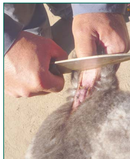
Foto 5. Corte de cola