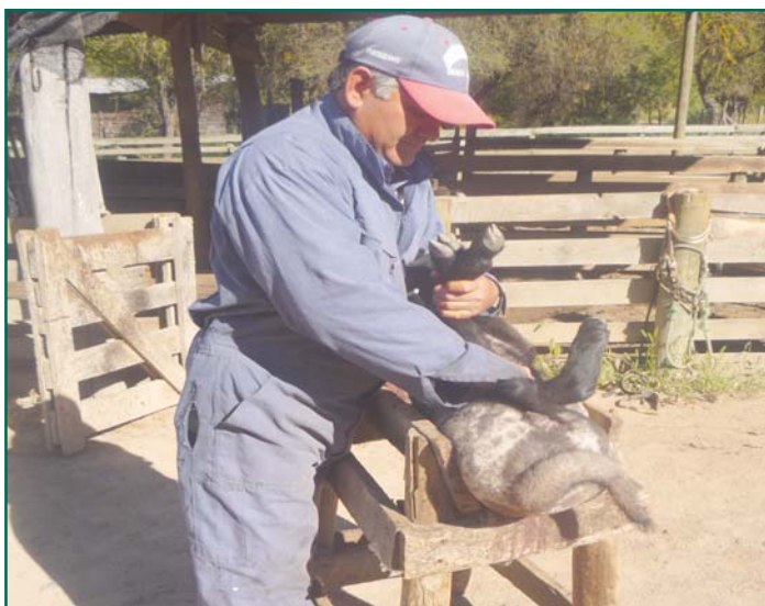
Foto 2. Ubicación del ovino en el banco para el descole