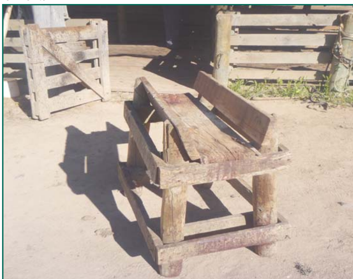
Foto 1. Banco para descole

1.- Bisturí o cuchillo. Es el método más usado, y consiste en cortar con un cuchillo afilado en la zona seleccionada. La operación se verá facilitada si participan dos personas y además se cuenta con un banco acondicionado para esta labor (Foto 1). Una persona sujeta al cordero por sus extremidades y lo sitúa en el banco de espalda y exponiendo la cola (Foto 2)