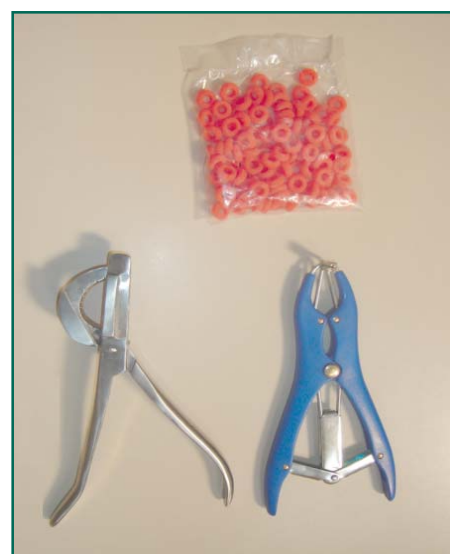
Foto 8. Elastrador