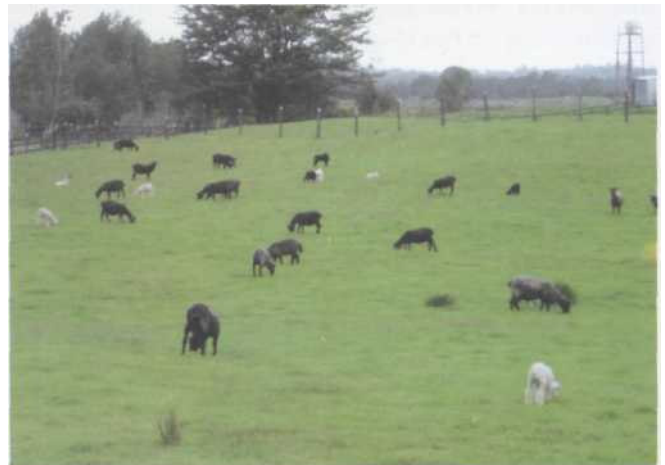
Foto 1. Distribución de ovejas en pastoreo.

Las ovejas son animales rumiantes, lo cual tiene dos grandes implicancias. Por un lado, su estómago está dividido en cuatro compartimientos distintos, donde el más grande es el rumen y contiene microorganismos que digieren la celulosa; y por otro lado, las ovejas rumian, es decir, una vez ingerido el alimento lo vuelven a llevar a la boca desde el estómago para masticarlo con los dientes de superficie plana, impregnarlo de saliva, humedecerlo e ingerirlo definitivamente para iniciar su digestión. Ambas características de las ovejas son consecuencias evolutivas, ya que sus antepasados al ser presa fácil para carnívoros que cazaban en grupo en las praderas abiertas, fueron adaptándose a comer rápidamente el pasto en grandes cantidades, para posteriormente en un sitio más seguro realizar el proceso de digestión. Esta estrategia de sobrevivencia permitió el desarrollo del proceso de rumia. La rumia es de suma importancia conductual, ya que ocurre cuando se ve a las ovejas echadas y moviendo las mandíbulas. Este momento es crucial en el proceso alimenticio y es muy importante no molestarlas y menos