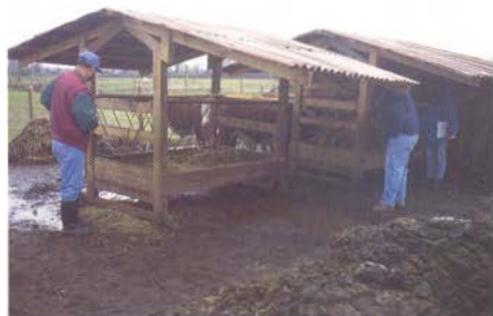
Comedero techado para heno.

La organización de los aspectos reproductivos y de manejo de praderas analizados en el Informativo N°23 son muy importantes en los resultados de una empresa ganadera. Existen, además, otros numerosos factores que también afectan los resultados. En esta segunda parte del Calendario de Producción Bovina, se analizarán los aspectos de alimentación y sanidad de los animales.