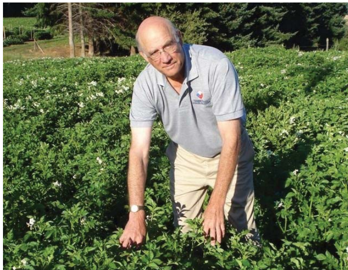
Dr. Gary Secor.

“El consumidor se ha vuelto más sofisticado y conocedor de las cualidades de las papas; hay mucho interés por variedades especiales con pulpa de color, mejores propiedades nutritivas y buen sabor. Las variedades de papa de Chile tienen todas estas características”, asegura el profesor estadounidense e investigador especialista en el cultivo de papa.