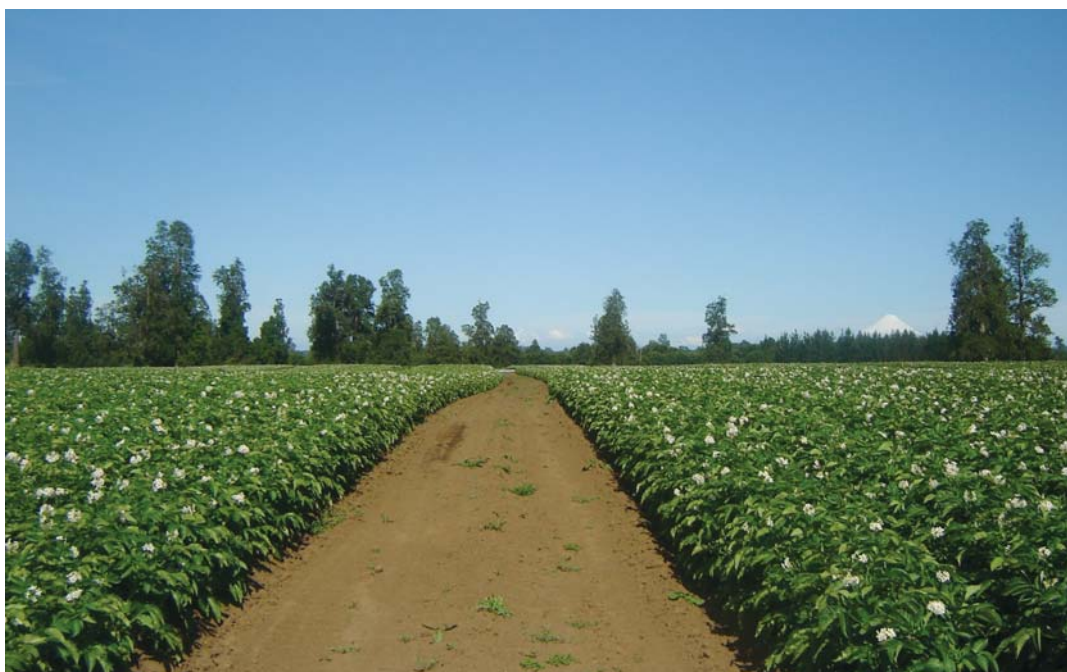
Semillero de papas, Centro Experimental La Pampa.