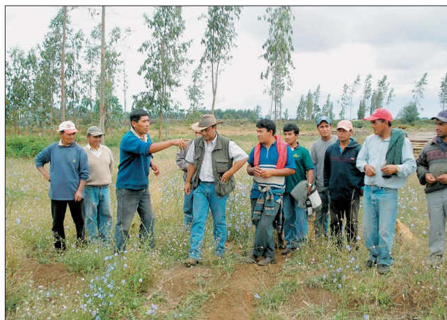
Capacitación en manejo del ganado bovino. Visita a terreno.

Seis comunidades beneficiarias del fondo de tierras se capacitaron para hacer una mejor gestión de los terrenos adquiridos.