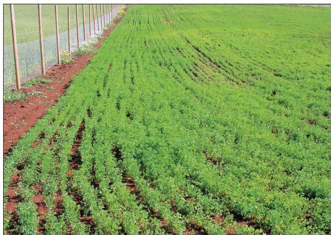
Unidad demostrativa de alfalfa, comunidad Ignacio Quilape.

contenidos entregados. Esto se reflejó en las unidades demostrativas, en especial aquellas que tenían por objeto proveer de semilla de papa a los productores, donde los rendimientos superaron las 25 toneladas por hectárea (t/ha) que normalmente alcanza un semillero a nivel de agricultura campesina (cuadro 1).