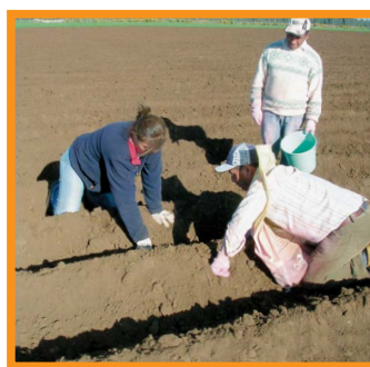
Capacitación en terreno con la metodología "aprender haciendo": siembra de papa

comunidades capacitadas en iniciación de actividades productivas agrícolas, dos de ellas, Treng Treng y Santos Huentemil, en la actualidad manejan facturas y mantienen una relación permanente con un contador que las asesora. Esto les ha permitido vender sus productos, comprar insumos y prestar servicios de maquinaria agrícola sin dificultades con el Servicio de Impuestos Internos.