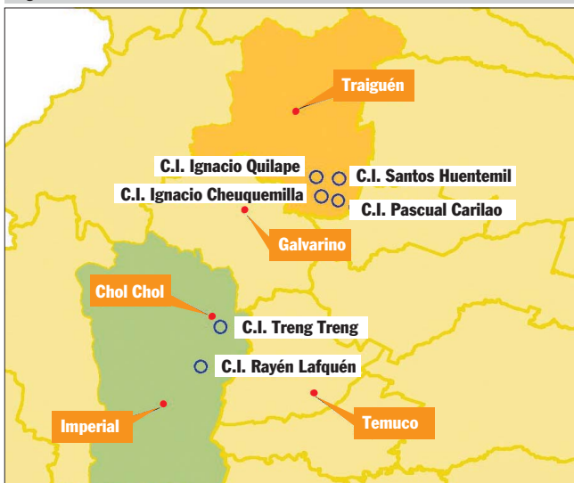
Figura 1. Ubicación de las localidades beneficiadas.