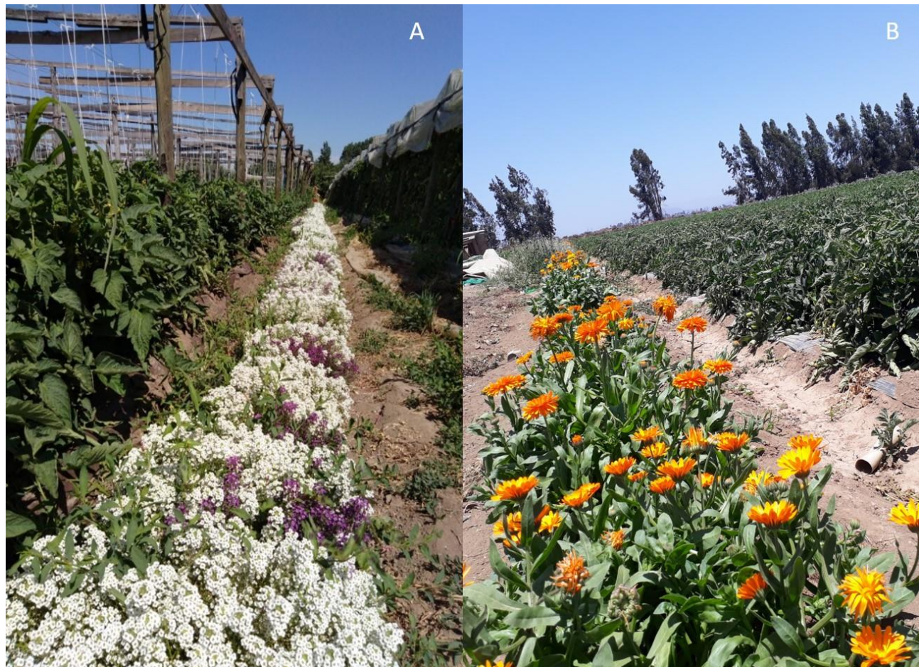
Figura 2. Flora funcional en dos sistemas de producción de tomate. A) Aliso marítimo y tomate guiado y B) caléndula y tomate botado. INIA Rayentué

Al incorporar diversidad funcional en los agroecosistemas, es posible ejercer cambios que favorecen la abundancia y la eficacia de los enemigos naturales de distintas formas. Esto debe llevarse a cabo a través de la incorporación de flora funcional, plantas con flores que atraen y mantienen con sus recursos de néctar y polen, una población de enemigos naturales (Salas, 2019).