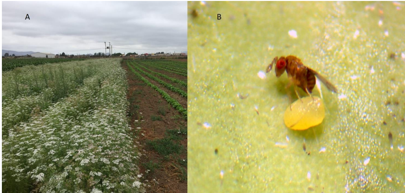
Figura 5. A) Consorcio cilantro-lechuga y B) adulto de Trichogramma pretiosum parasitando huevo de polilla del tomate. INIA Intihuasi