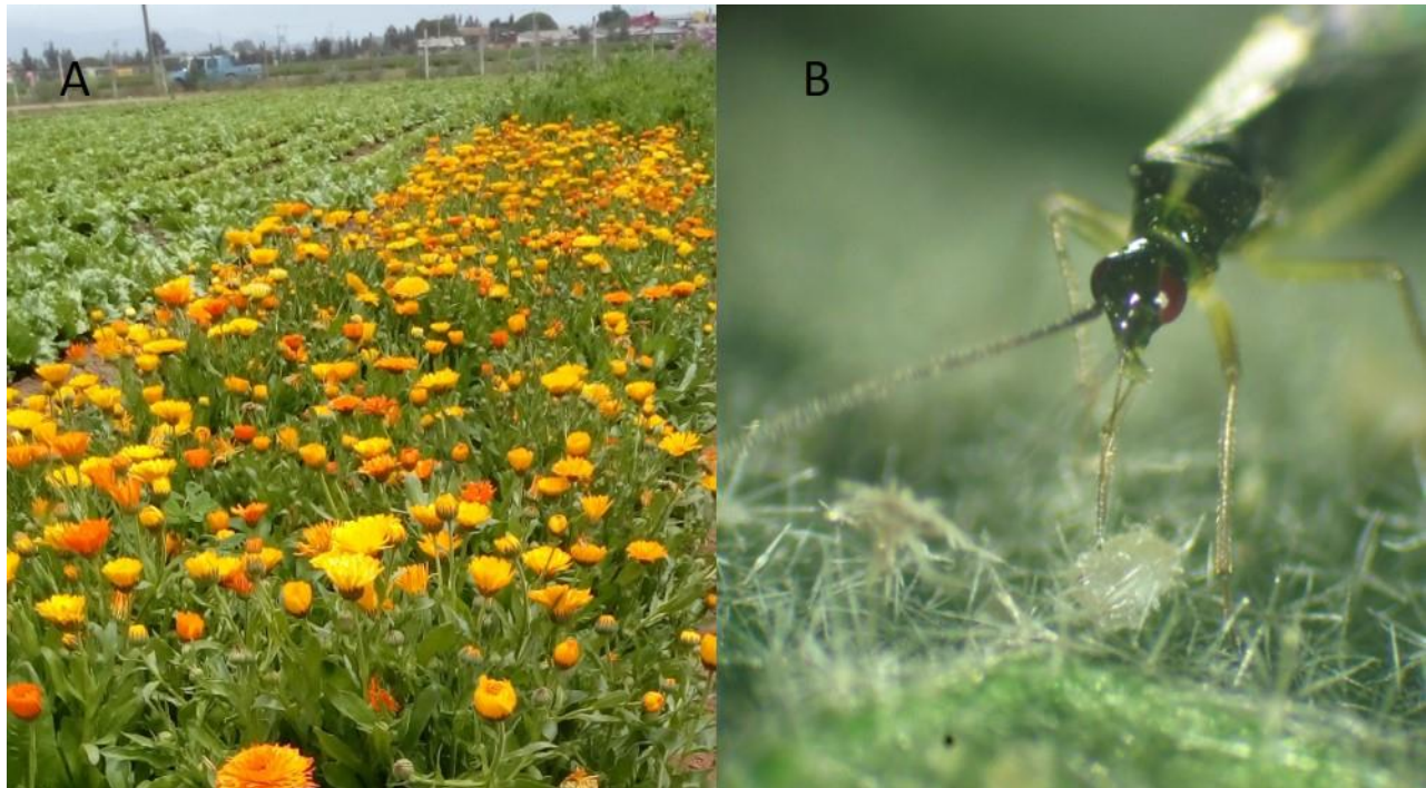
Figura 3. A) Banda floral de caléndula y B) adulto de Tupiocoris cucurbitaceus depredando ninfa de mosquita blanca. INIA Intihuasi

recomienda disponer una franja en el exterior de los invernaderos ya que de esta forma impedirá el ingreso de la polilla, y también porque atraerá al tupiocoris.