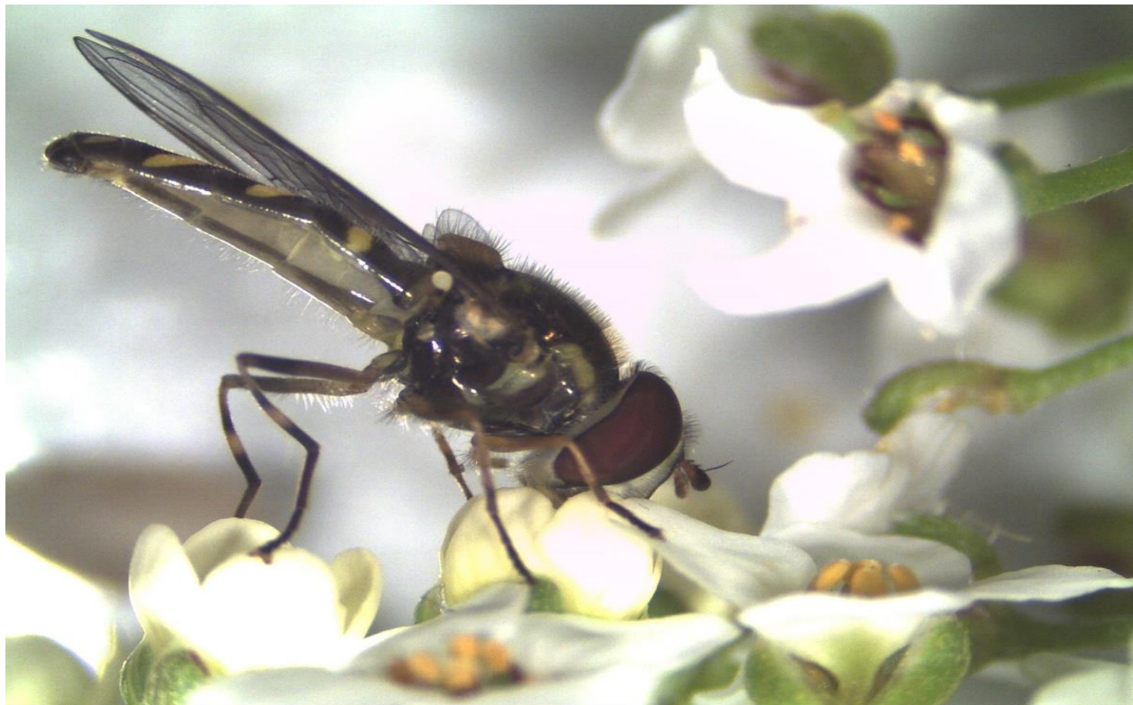
Figura 1. Adulto de mosca florícola alimentándose de néctar y polen de flor de aliso marítimo. INIA Intihuasi

Otro rol de la flora funcional es actuar como fuente de presas alternativas para los enemigos naturales en aquellos momentos en el cultivo principal no se encuentra con plagas. Asimismo, la flora funcional puede actuar como refugio para los enemigos naturales en estado adulto para resguardarse de las condiciones ambientales adversas.