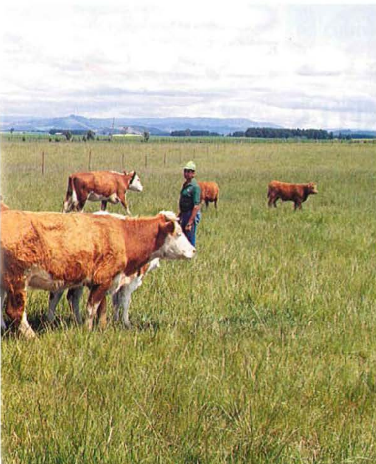
Hibridaje de Clavel con Hereford.