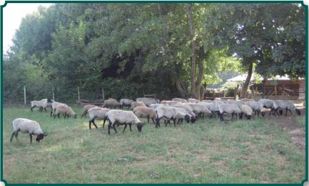
Foto 2. Rebaño de ovejas Suffolk Down.