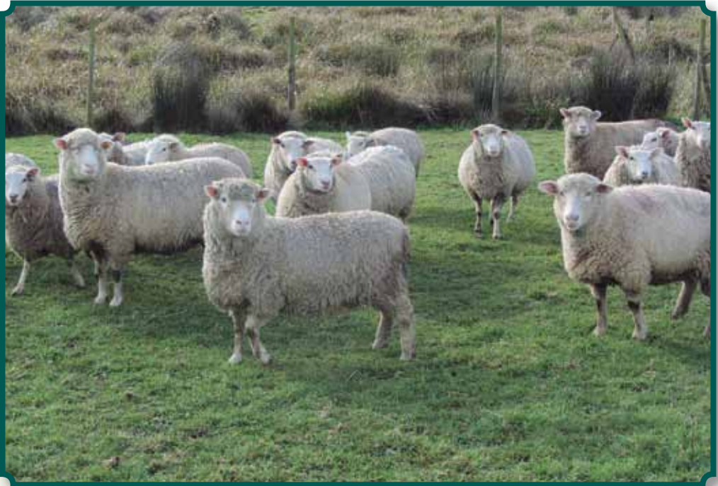
Foto 6. Ovejas Cuádruples.