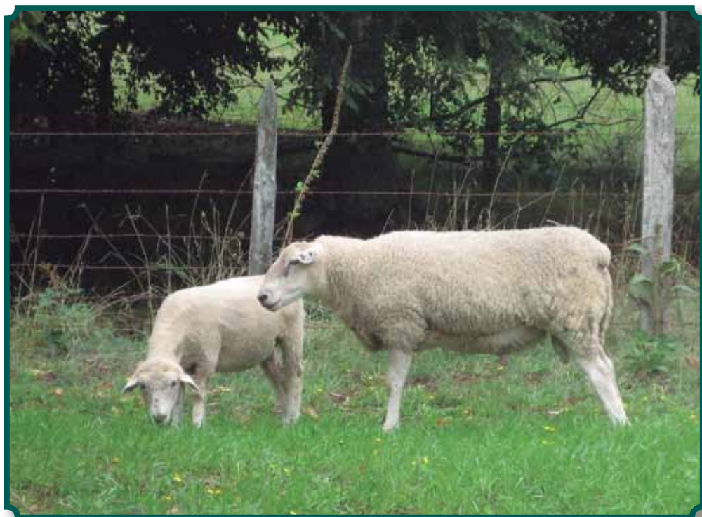
Foto 5. Carnero Texel.