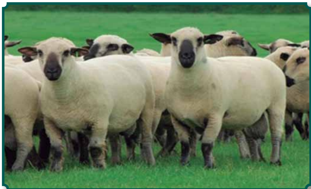
Foto 3. Carneros Hampshire Down.