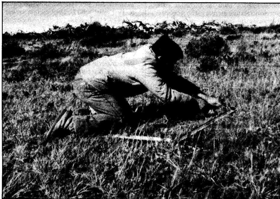
Foto N° 2: Segado de la pradera para estimar la cantidad de materia seca disponible en cada tipo vegetacional