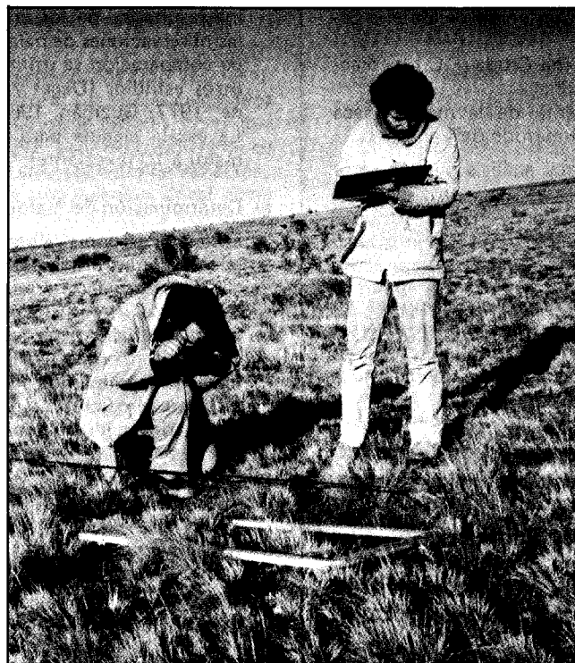
Foto Nº 1: Equipo de profesionales realizando un inventario de la vegetación mediante el método del "Point Quadrat", con el objeto de determinar la composición botánica y el recubrimiento de la pradera.

La composición botánica de la pradera para cada inventario, se estimó a partir del número de contactos contabilizados para las distintas especies. La proporción relativa en que están presentes las distintas especies de la pradera, se expresa a través de la Contribución Específica de Contactos (CSC), y cuyo cálculo se hace con la siguiente fórmula: