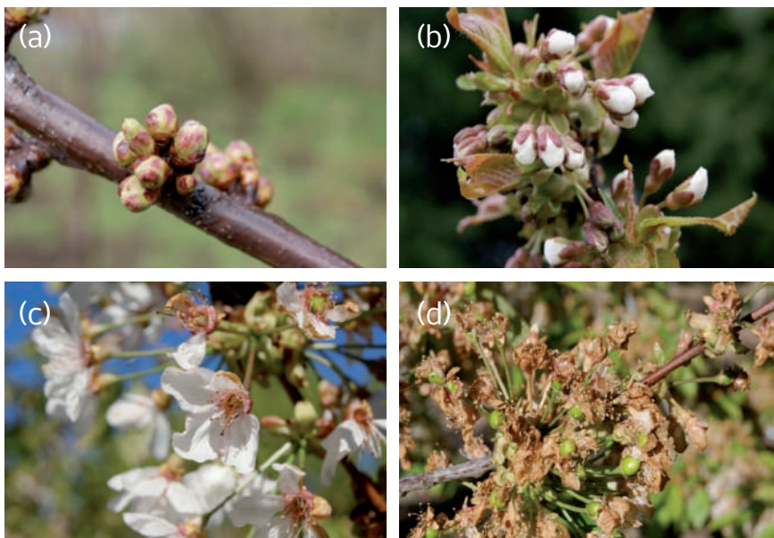
Figura 5.3. Estados fenológicos del cerezo: (a) Yema hinchada, (b) Puntas blancas, (c) Plena flor, (d) Fruto cuajado.

Según las temperaturas registradas en los últimos 10 años en Chile Chico y la susceptibilidad de las yemas del cerezo al daño por congelamiento, se puede concluir que existe un alto riesgo de daño en flores y frutos de cerezo por bajas temperaturas, lo que hace necesario disponer de eficientes sistemas de control de heladas.