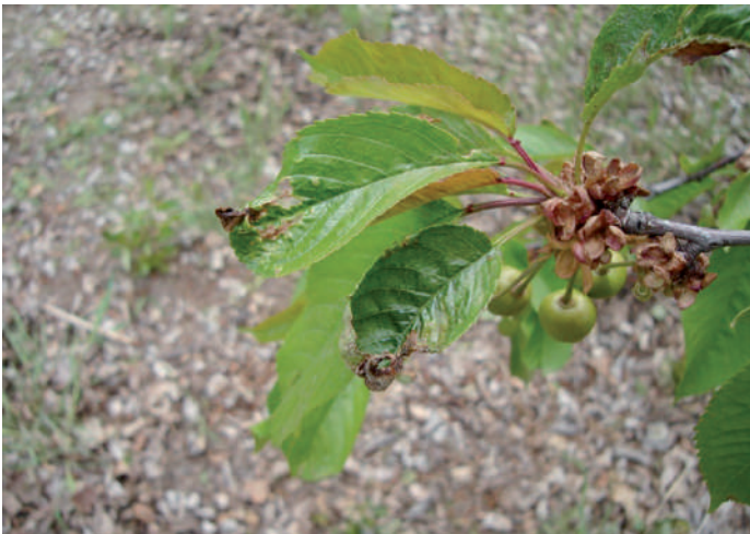
Figura 5.2. Punta necrosadas de hojas juveniles debido a daño por frío.

Además de daño en frutos, se ha determinado en la variedad Kordia, producto de las bajas temperaturas daño en las puntas de las hojas (Figura 5.2).