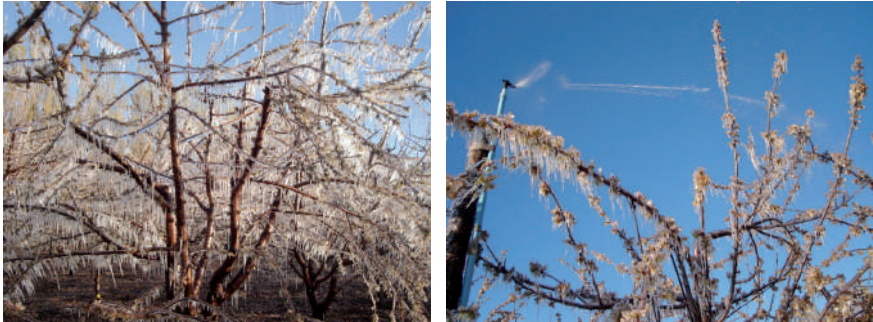
Figura 5.5. Control de heladas por aspersión.

incremento de la temperatura ambiente, no se apreciaran daños en hojas, flores y frutos, debido a que la temperatura en estos órganos vegetativos no descenderá de 0°C (Figura 5.5).