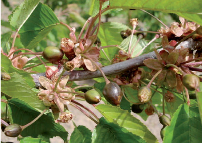
Figura 5.1. Daño por bajas temperaturas en frutos

necrosis de los tejidos (Figura 5.1). En las flores se produce la muerte del gineceo, mientras que en los frutos, éstos se pueden deshidratar, cambiar de color, caerse del árbol o, con daños menos severos, presentar superficies corchosas o deformaciones. Todos estos daños influyen negativamente en la producción, ya sea por disminución de los rendimientos o por aumento del descarte.