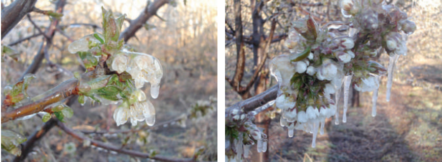
Figura 5.3. Yemas, flores y hojas cubiertas por una capa de hielo.

El sistema de control por "cambio de estado", permite según experiencias realizadas en la zona frutícola de la Región de Aysén, controlar heladas de hasta -7\text{ }^{\circ}\text{C} , siendo una de las limitantes de la misma, la acumulación de hielo en yemas, flores, brotes tiernos, que por efecto del peso, puede producir daños mecánicos, por la excesiva carga de hielo, por tanto, como regla general se intensifica la precipitación de agua, según la intensidad de la heladas, es decir según el descenso de la temperatura, de manera de congelar solo el agua que se está depositando sobre los tejidos (Figura 5.3).