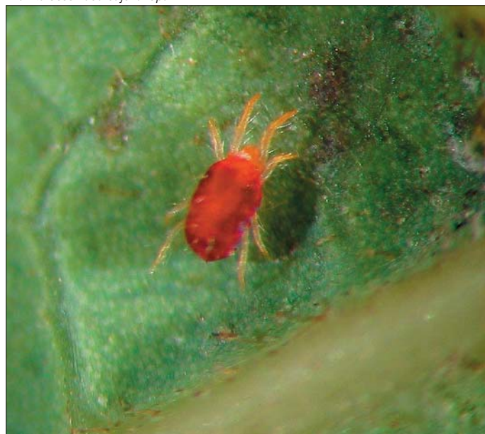
Arañita observada bajo la lupa.