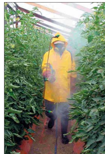
El ajuste de volumen de agua en los equipos es una de las herramientas técnicas implementadas.

lo tanto los programas de aplicaciones fueron más frecuentes, se lograron importantes ahorros: $558.511 menos de costo en tomates primor en Limache y $385.855 menos de costo en clavel en Quillota. El menor impacto en términos porcentuales se produjo en claveles en Hijuelas, donde la situación fitosanitaria puede estar relacionada a altos niveles de resistencia y concentración de sectores monocultivados.