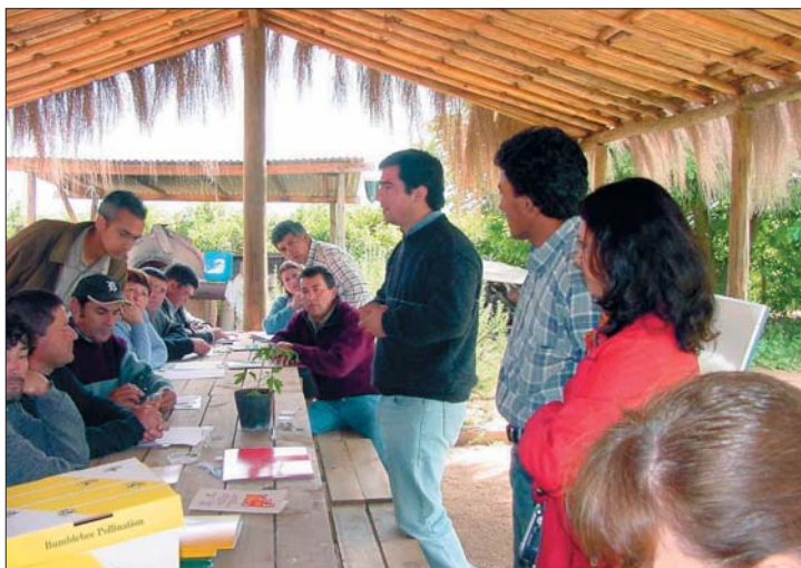
Los módulos demostrativos implementados con agricultores líderes permitieron enseñar las 10 herramientas técnicas definidas en el diagnóstico.