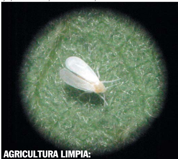
Ejemplar adulto de mosquita blanca visto con lupa.