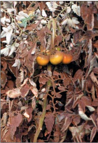
Daño grave de mosquita blanca en tomate: fumagina en hojas y frutos.

Vallelua Ltda., Agroclavel S.A., Allendes Consultora, Proyecta Consultora Ltda., Agrogestión Ltda., Desarrollo Rural y PRODESAL. Se espera que los monitores a su vez capaciten a todos los agricultores de su comunidad.