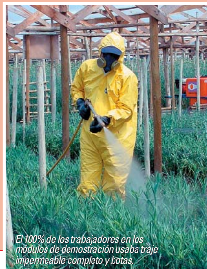
El 100% de los trabajadores en los módulos de demostración usaba traje impermeable completo y botas.

Los hábitos de higiene personal en los módulos demostrativos son adecuados, ya que más del 83% de los trabajadores toma un baño diario y se cambia ropa después de una aplicación. En cambio en el grupo control, el hábito de cambio de ropa es menos frecuente