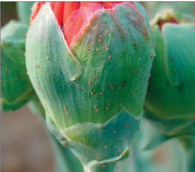
Daño grave provocado por araña en botón de clavel, producto de una detección tardía de la plaga.

Durante este proceso se consideró que los pequeños agricultores ocupan la mayor parte de su tiempo en plantar, fertilizar, aplicar plaguicidas, comercializar,