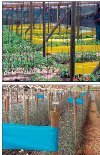
El uso de trampas pegajosas permite tanto la captura de adultos (arriba) como la detección temprana de una plaga (abajo).

No existe una normativa sobre LMR para flores de corte, por lo tanto es difícil tener una referencia válida sobre los resultados en clavel. Sin embargo, se pueden