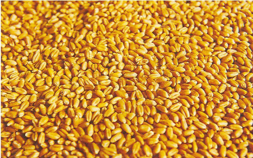
Se ha comenzado a extender la aplicación de una cantidad adicional de nitrógeno en la etapa de dos a tres nudos, que mejora en forma apreciable la calidad del grano.

sis utilizadas, hacen que la fertilización constituya, normalmente, sobre el 50% del costo total de producción.