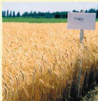
Sementera de trigo variedad Tamoi INIA

Aunque los rendimientos de trigo en el secano interior son bajos, debido a muchas razones señaladas en innumerables artículos técnicos, este cereal constituye un rubro básico para la gran mayoría de los productores, especialmente para los que lo destinan a su propio consumo.