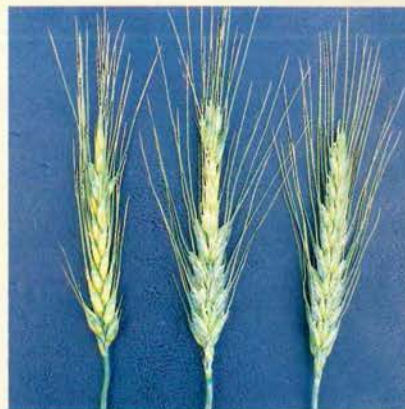
Efecto de la sequía en la espiga. Se puede observar la ausencia de espiguillas en la parte superior de la espiga

Producto de la sequía, se observó aborto floral, el que se manifestó en la muerte del tercio superior de la espiga, según se observa en la foto 3.